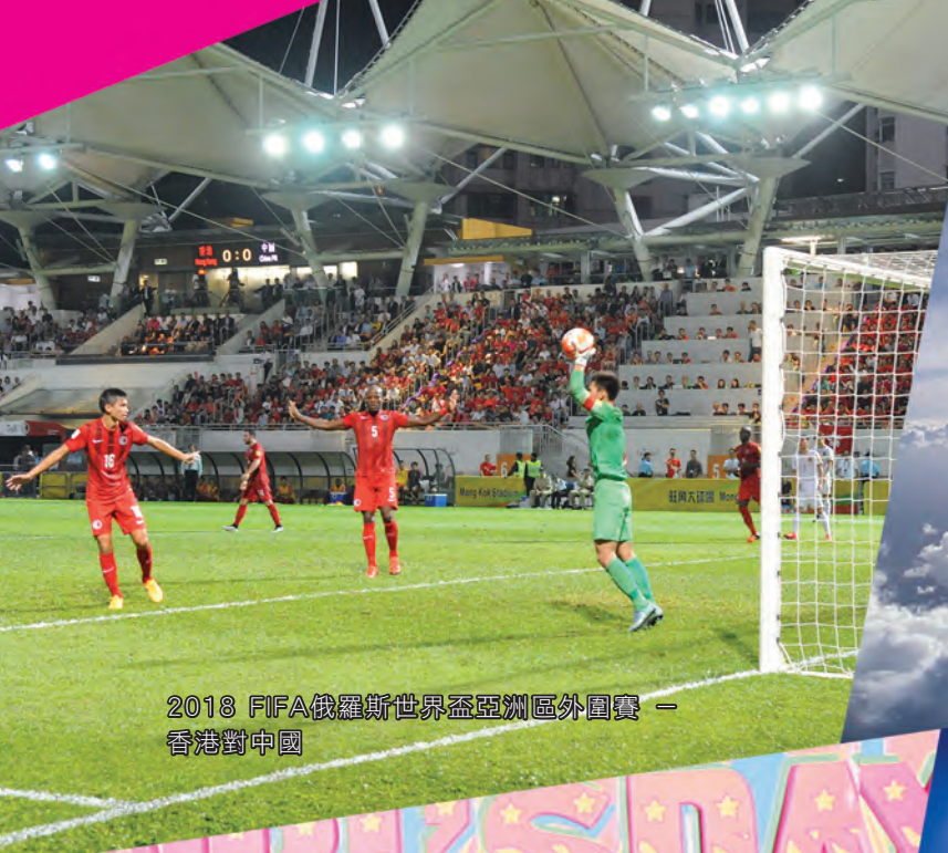
2018 FIFA俄羅斯世界盃亞洲區外圍賽 — 香港對中國