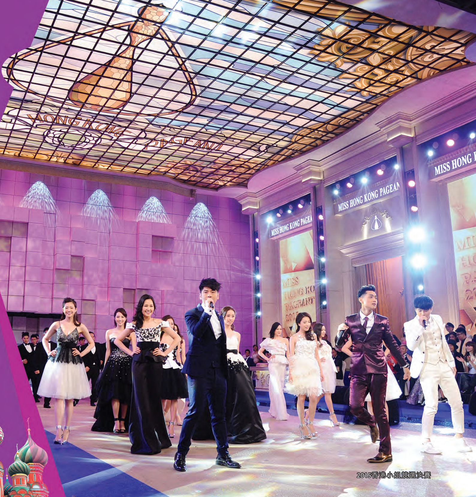
2015香港小姐競選決賽