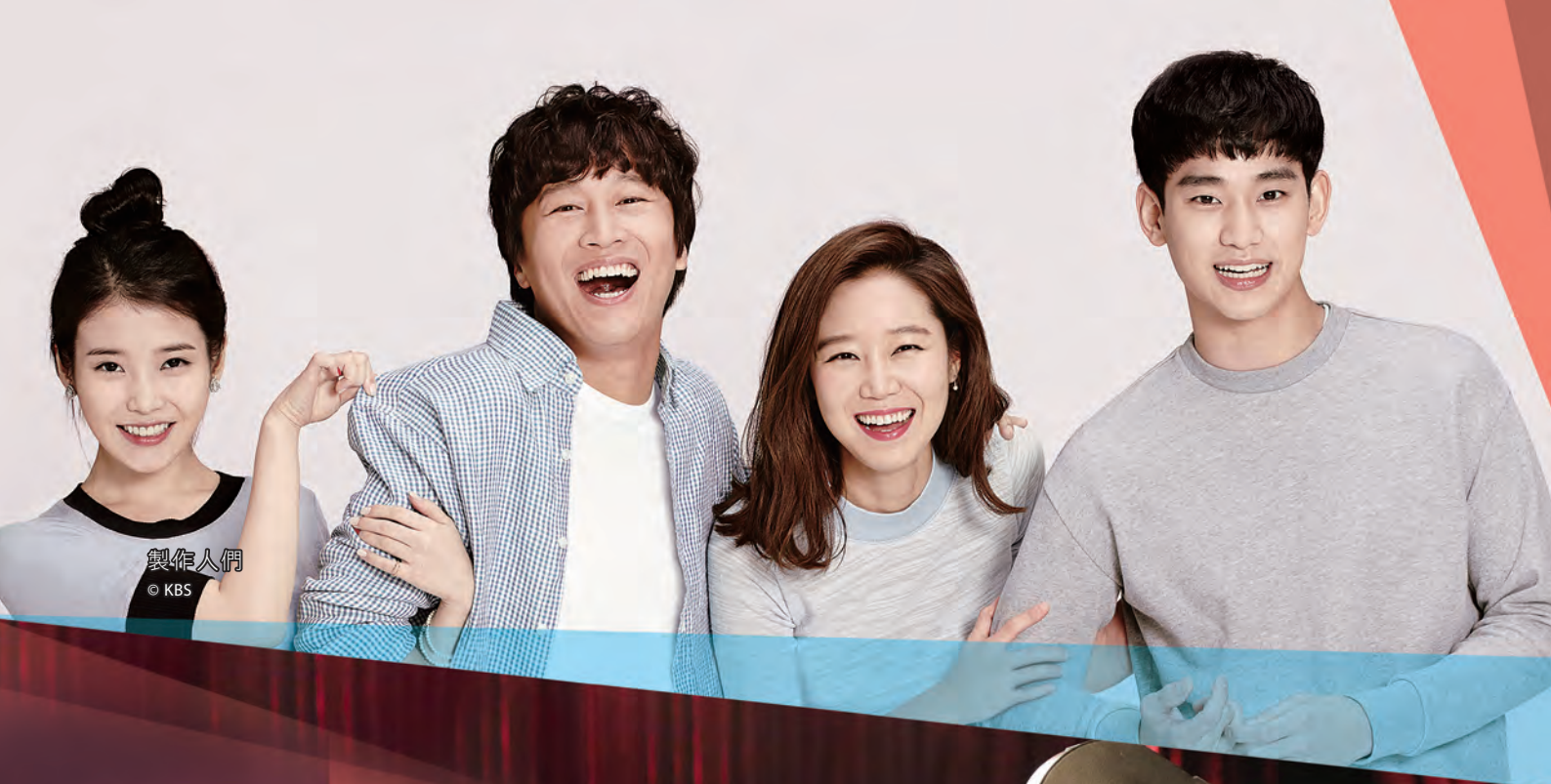
製作人們