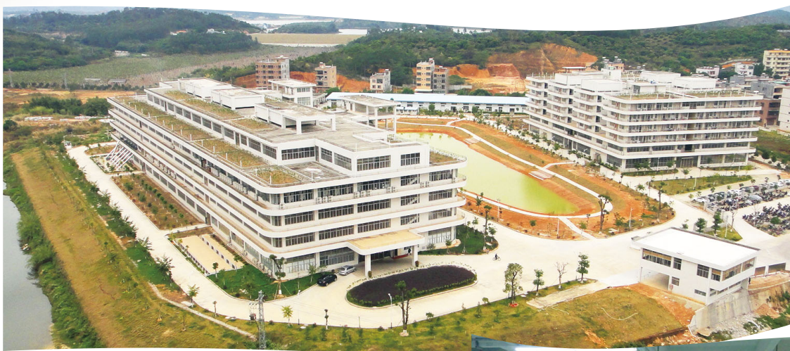
中國湖鎮東風村廠房及宿舍大樓