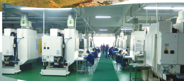
中國湖鎮東風村廠房生產線