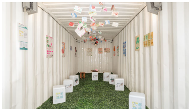
贊助文化葫蘆組織的香港賽馬會「港文化·港創意」×元朗&屯門展覽，香港