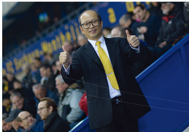
主席在主場為FCSM加油