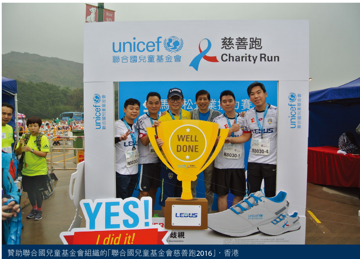
贊助聯合國兒童基金會組織的「聯合國兒童基金會慈善跑2016」，香港

截至二零一七年六月三十日止六個月，本集團之營業額減少至約人民幣103,600,000元。營業額減少主要歸因於(i) LED照明分部貢獻之營業額減少；及(ii)職業足球俱樂部分部之收入減少。