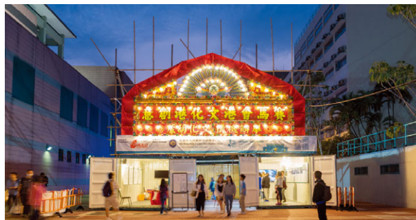
贊助文化葫蘆組織的香港賽馬會「港文化·港創意」×元朗&屯門展覽，香港

LED照明業務仍為本集團之業務重點，前路依舊充滿挑戰。面對LED照明業務的激烈競爭、全球政治不穩及全球市場經濟增長緩慢，本集團預期本集團LED照明業務增長將放緩。本集團將繼續拓展新市場及客戶，以擴闊客戶基礎及本集團之收入來源。此外，本集團將採取所有降低生產成本之適用措施，提高競爭力。本集團亦將檢查現有製造廠房之成本及產量的效率及效力。本集團可能考慮精簡現行生產流程以提高本集團競爭力。本集團亦將繼續投入資源進行產品與技術開發。