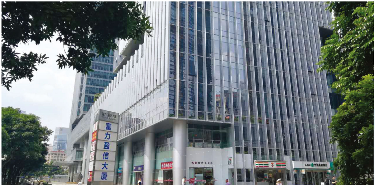
中國廣州物業的外觀

經考慮今後面對之挑戰及自家品牌名稱「LEDUS」之競爭優勢，本集團對LED照明業務前景仍審慎樂觀。然而，本公司董事繼續採取審慎措施管理本集團以實現可持續發展。此外，本集團會繼續發掘其他商機支持核心業務，同時尋求多元化發展，務求提升本公司及股東整體的價值。