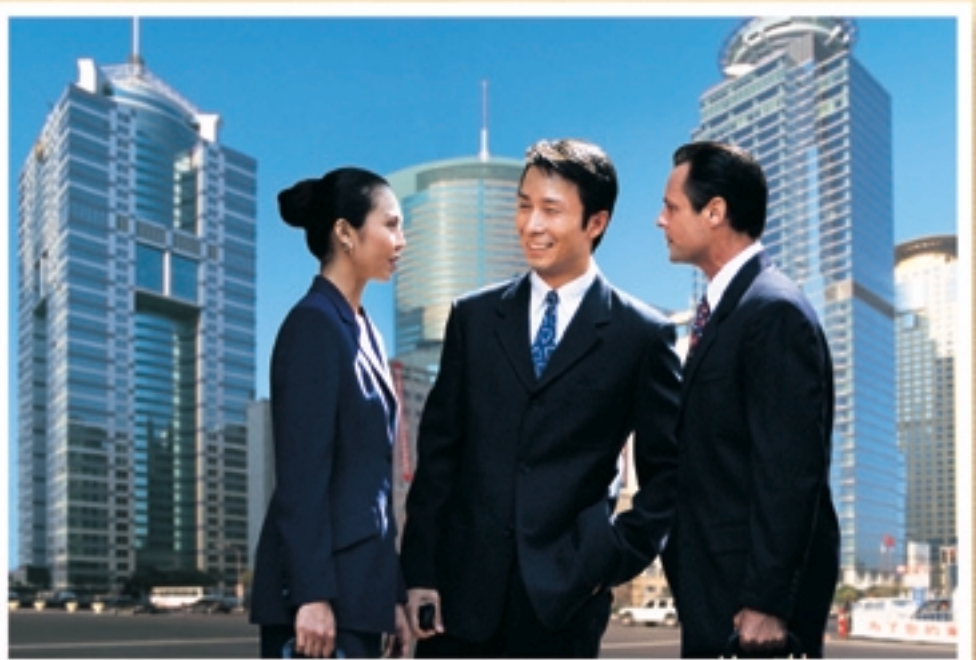
In November 2004, PCI unveiled plans to become part of a new life insurance company in mainland China and announced an application to the China Insurance Regulatory Commission.

Year 2004 also saw the highest total premium on life insurance business ever achieved by PCI, along with a recommendation for dividend payouts totaling 10 cents per share.