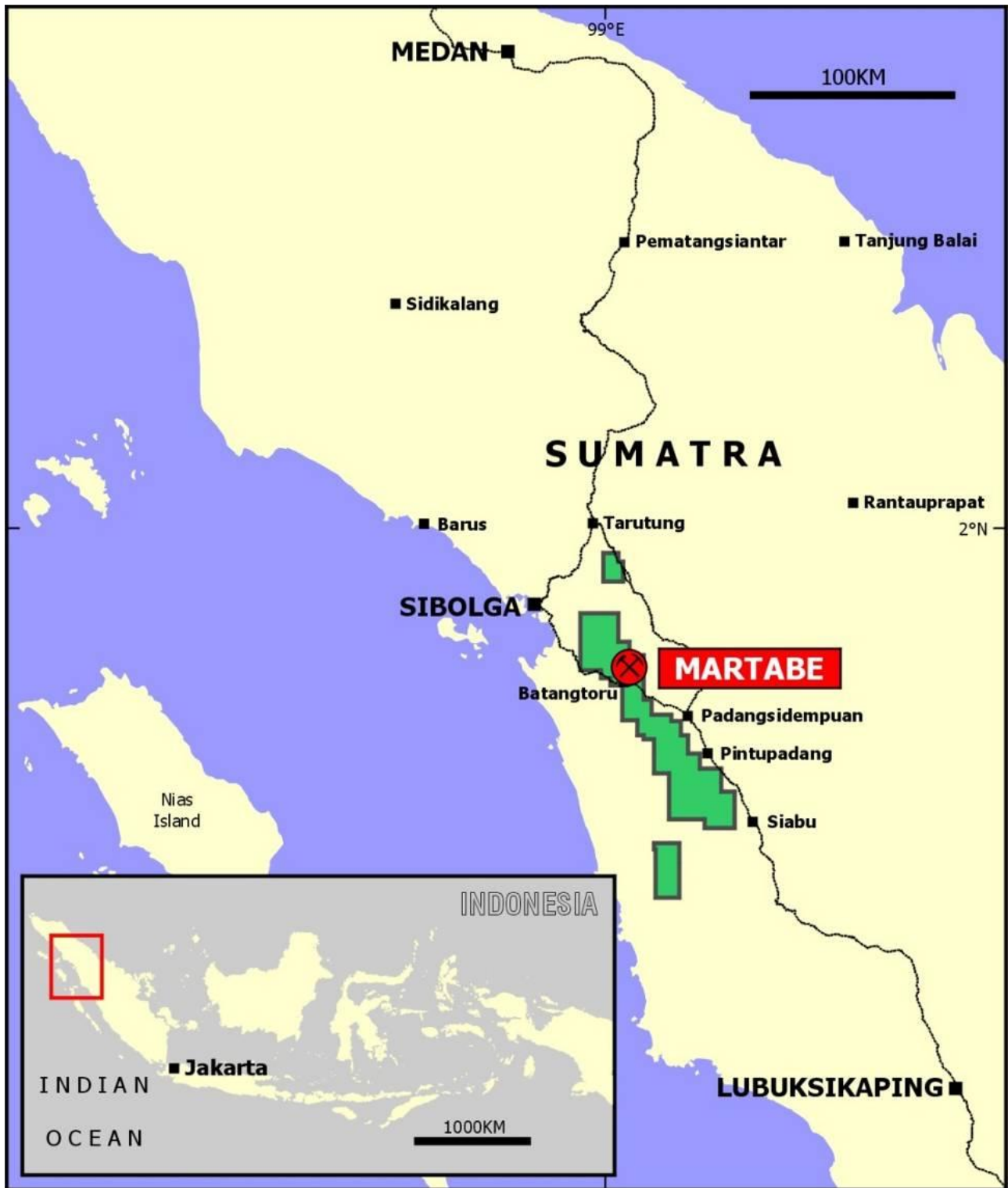
圖一 Martabe 金銀礦項目位置。