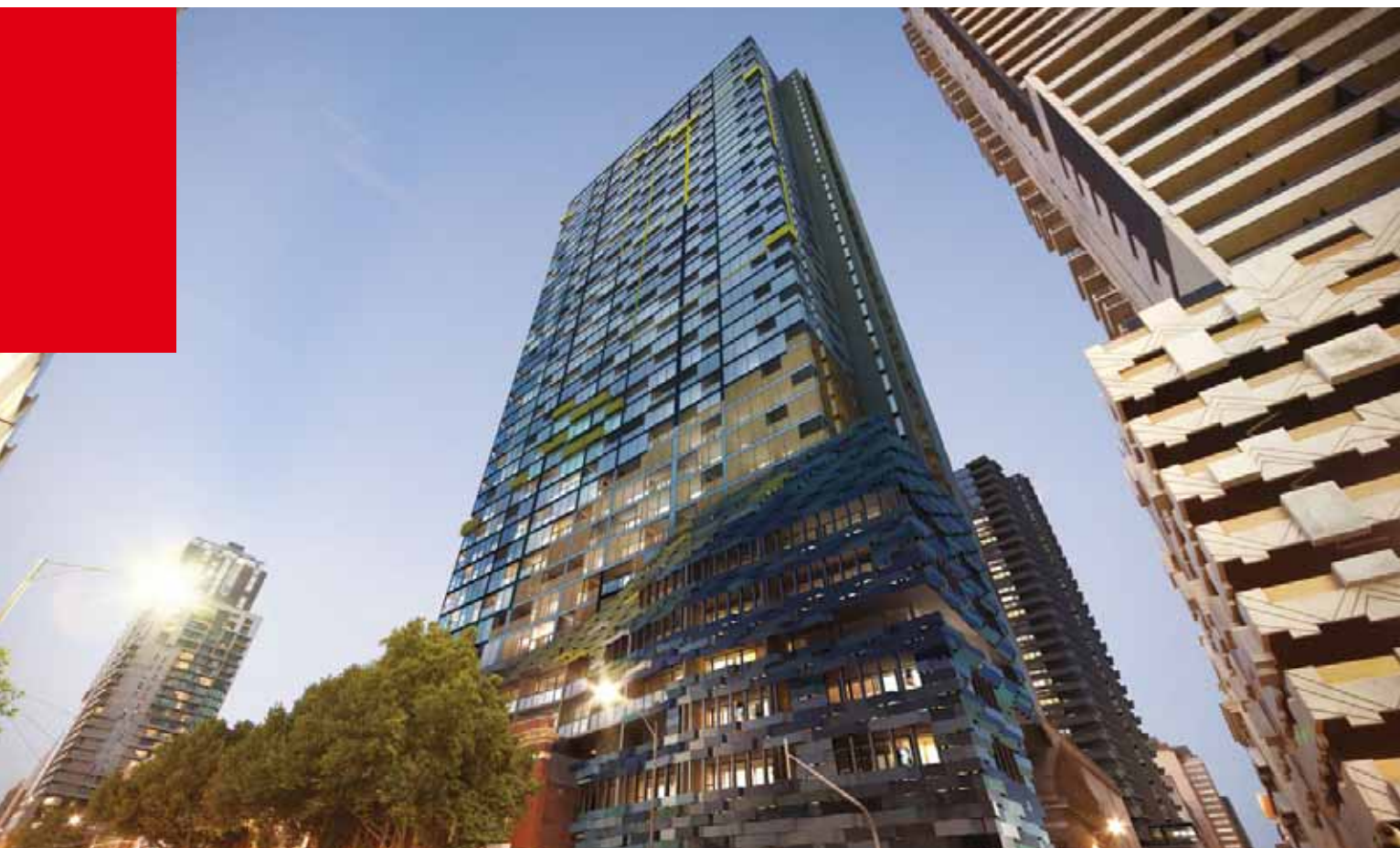
澳洲墨爾本 Upper West Side