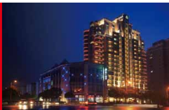
中國內地上海 麗悅酒店