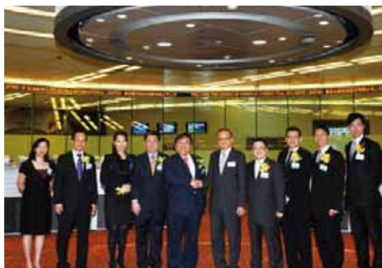
聯交所高級職員與麗悅管理層在交易大堂合照慶祝麗悅上市