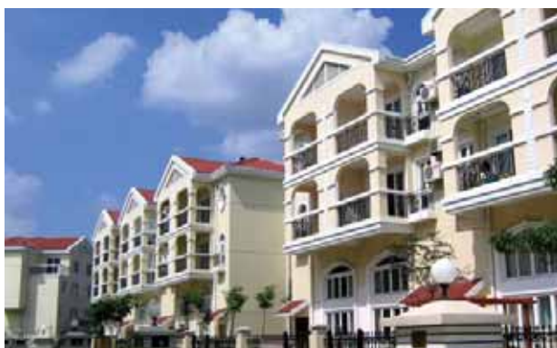
中國內地上海 錦秋花園

花地家園沿廣州花地河岸而建，建築面積約為1,030,000平方呎，計劃興建涵蓋5幢住宅大樓之社區。建設工程預計於截至二零一二年三月三十一日止財政年度下半年展開，另預計分別於二零一四及二零一五財政年度進行預售及完工。