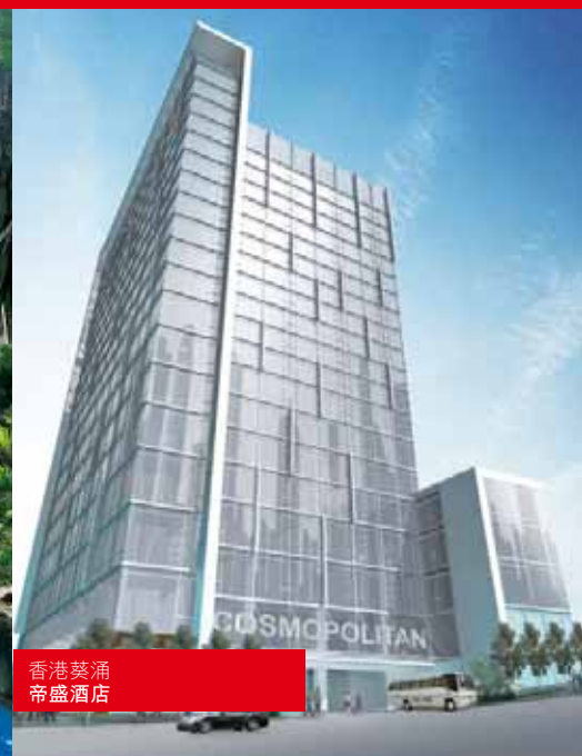
香港葵涌 帝盛酒店

截至二零一一年三月三十一日止年度，有兩間酒店已建成並已投入運作。於二零一零年七月，香港旺角麗悅酒店已開業，合共25層高，提供285間客房。此酒店專注於旅遊業務，著眼於來自中國內地、東南亞、日本及韓國之旅客。於二零一零年二月，中國內地上海麗悅大酒店投入運作。此酒店樓高18層，有264間客房。由於其位處鄰近上海展覽中心及上海浦東區世紀公園，專為商務及旅遊顧客服務。