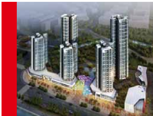
中國內地廣州 花地家園