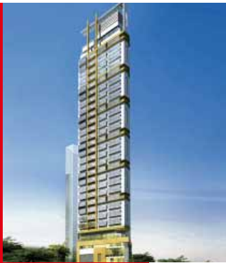
香港薄扶林 山道90-100號