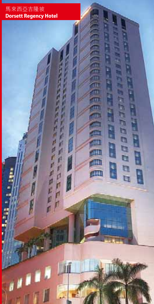
馬來西亞吉隆坡 Dorsett Regency Hotel

截至二零一一年三月三十一日止年度，有兩間酒店已建成並已投入運作。於二零一零年七月，香港旺角麗悅酒店已開業，合共25層高，提供285間客房。此酒店專注於旅遊業務，著眼於來自中國內地、東南亞、日本及韓國之旅客。於二零一零年二月，中國內地上海麗悅大酒店投入運作。此酒店樓高18層，有264間客房。由於其位處鄰近上海展覽中心及上海浦東區世紀公園，專為商務及旅遊顧客服務。