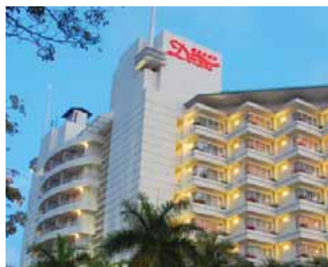
馬來西亞納閩 Grand Dorsett Labuan Hotel