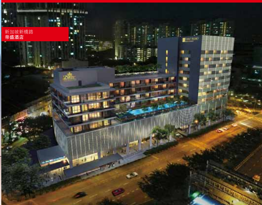
新加坡新橋路 帝盛酒店