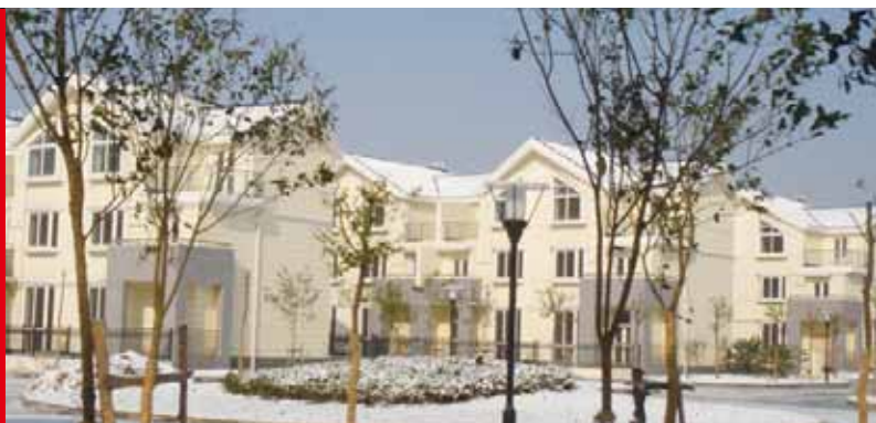
中國內地上海 錦秋花園