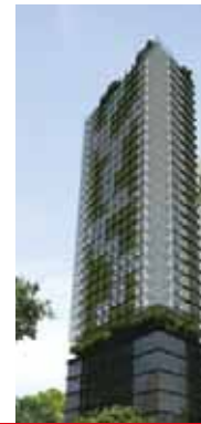
馬來西亞吉隆坡 Imbi Road 67區，470地段