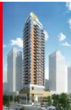
香港紅磡 新圍街1-11A號