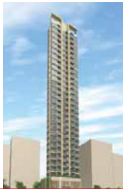
香港深水埗 西洋菜街北287-293號