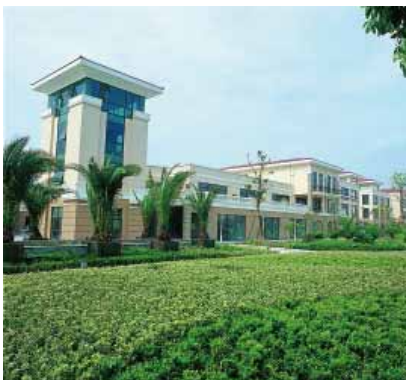
中國內地上海 錦秋花園