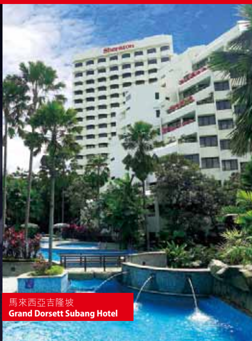
馬來西亞吉隆坡 Grand Dorsett Subang Hotel