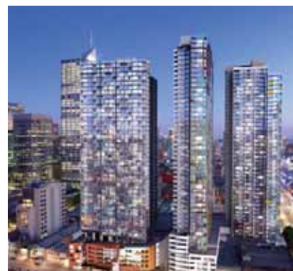
澳洲墨爾本 Upper West Side