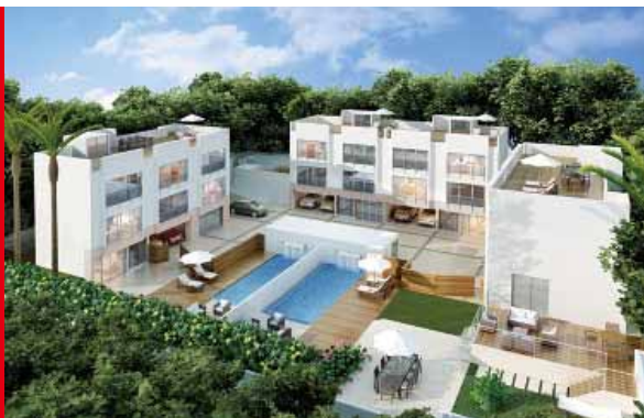
香港西貢 清水灣道684號