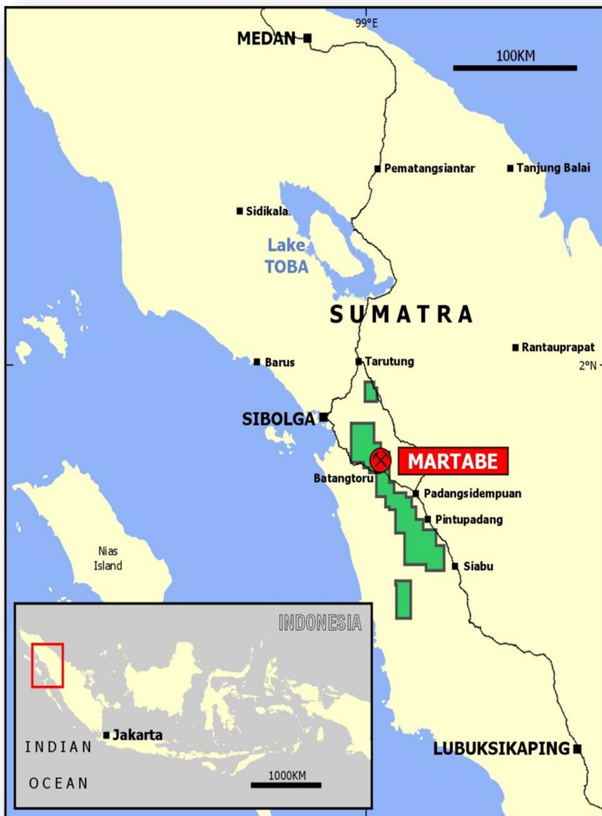
圖一 Martabe 金銀礦項目位置。