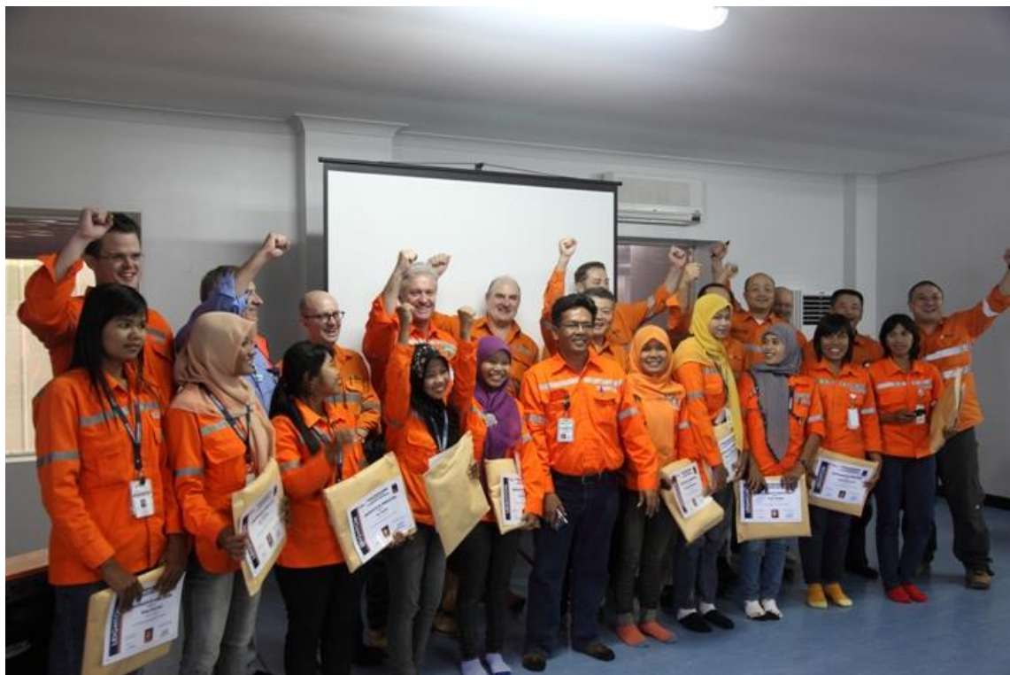
圖片一. 十名首批女駕駛員喜獲採礦卡車培訓課程之合格證書。