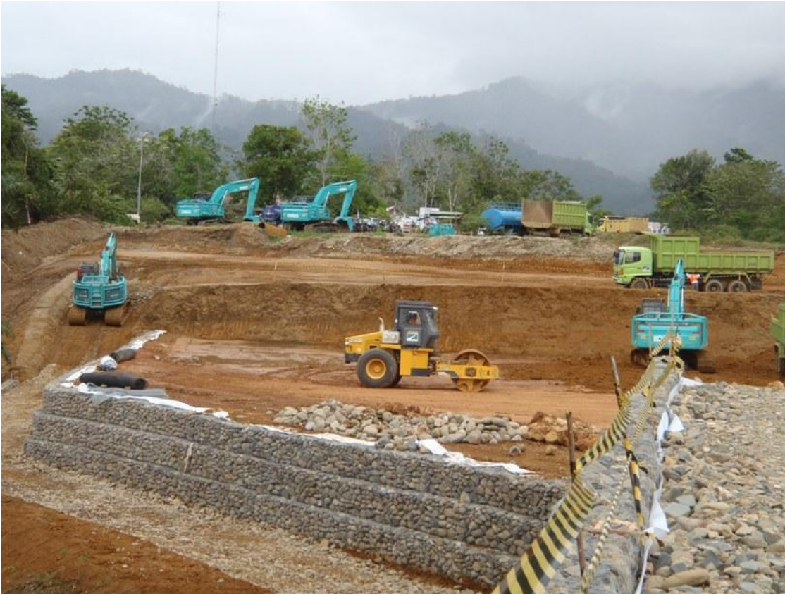
圖片五. 主要承建商Duta Graha Indah在Martabe工地施工。