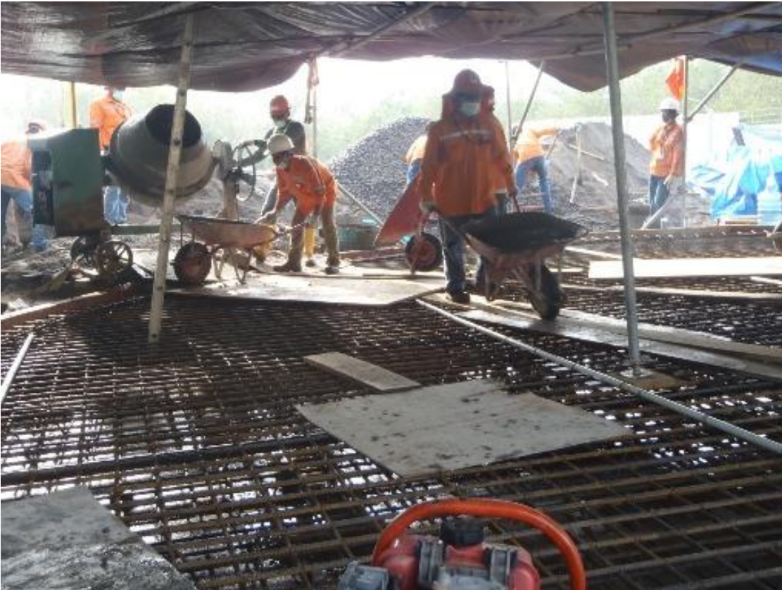
圖片四. 工地基礎設施澆注混凝土。