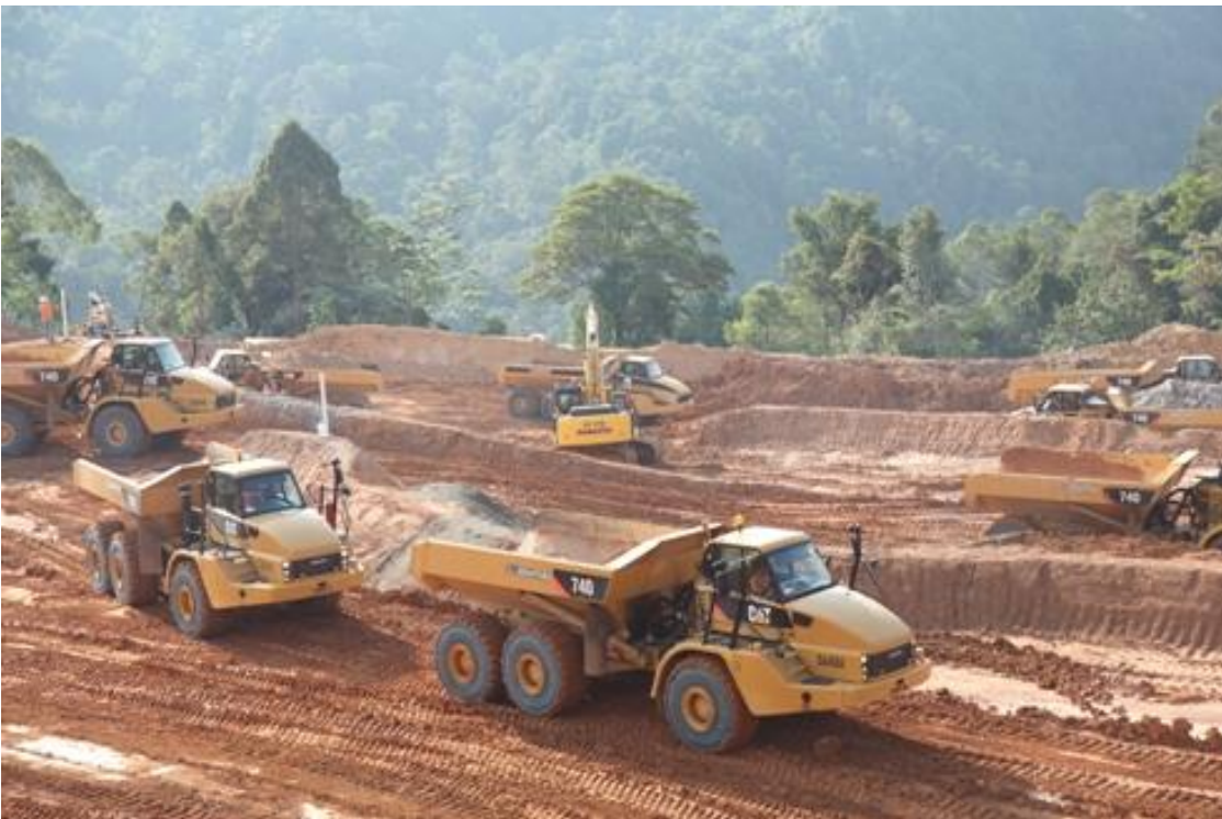
圖片六. 主要承建商Leighton Asia在處理廠區施工。