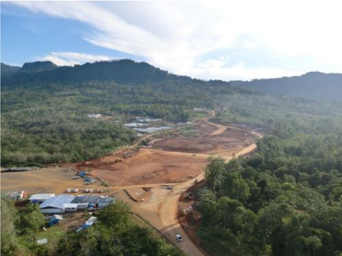
圖片三. 工地全景：前為辦公室，中為物料儲存區，遠處為營房。