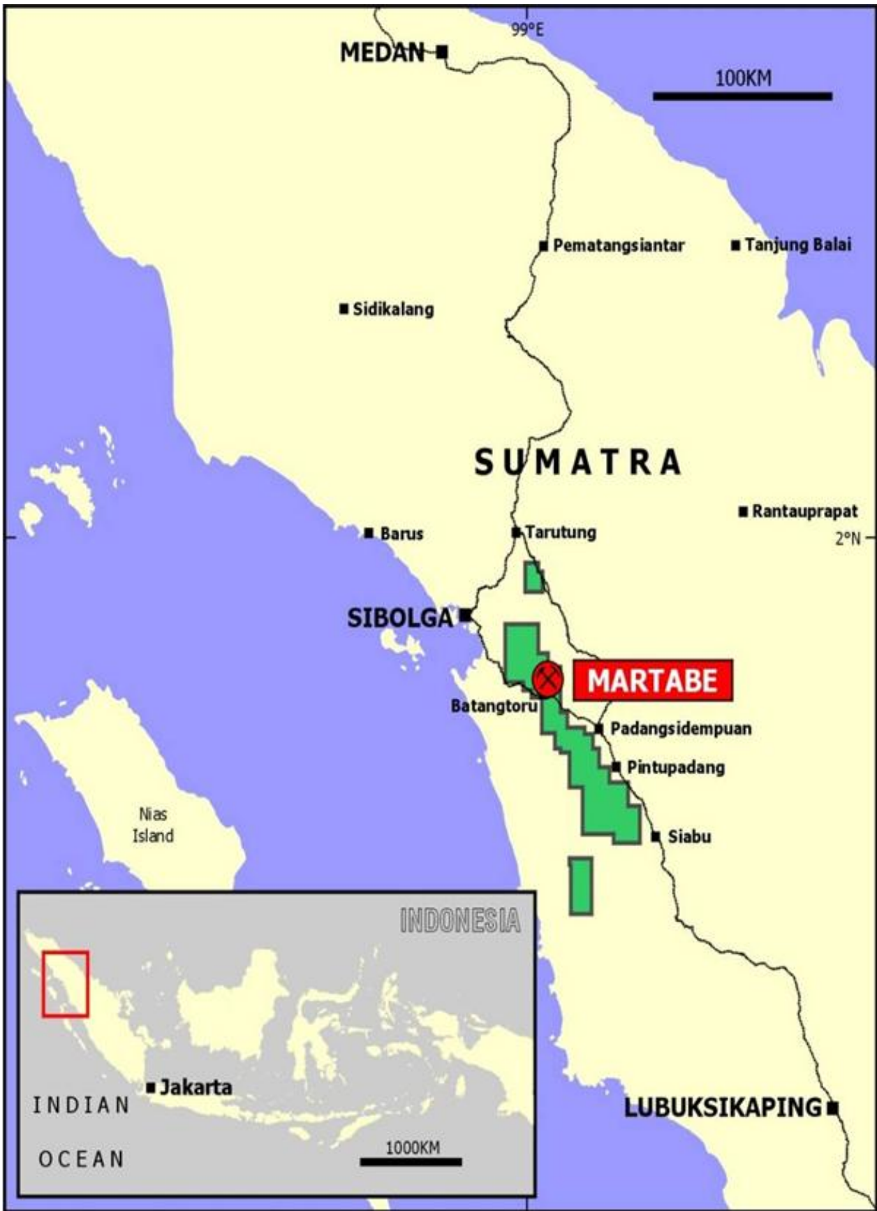
圖一. Martabe 金銀礦項目位置。