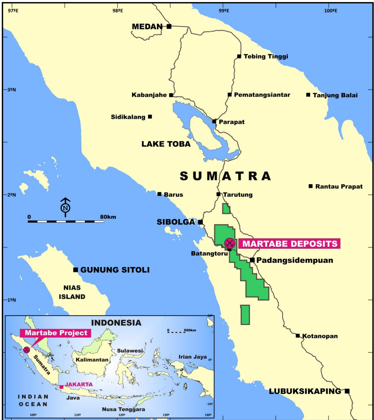
圖一. Martabe 金銀礦項目位置。