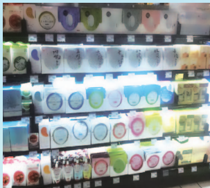
大賣場／超級市場陳列

除於二零一三年擴充終端門店數以外，我們持續優化現有終端門店的營運，此作法亦屬重要。於回顧期間內，現有終端門店取得了較去年同期約 15.0% 銷售增長的理想經營業績，貢獻本期間內總體銷售收入增長額約 48.7% 。