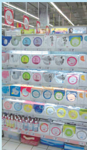
大賣場／超級市場陳列

於二零一二年十二月三十一日，經銷商數量為 288 家(於二零一二年六月三十日為 261 家)及覆蓋的終端門店數為 12,471 家(於二零一二年六月三十日為 10,184 家)，於本期間內新淨增 2,287 家門店。在新增門店總數中，新增門店部份是源於在主要城市原有銷售渠道開設新店，以及補充開發了部份資質較好的中小型商超賣場。於本期間內，個人護理用品連鎖店由 1,190 家增加至 1,434 家，及各類商超賣場門店由 3,855 家增加至 4,781 家。三、四線市場的美容用品專營店數量由 3,575 家增加至 4,197 家。主要位於北京及上海的便利店由 1,564 家增加至 2,059 家。