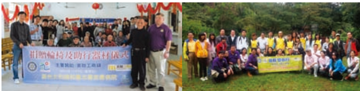
5 本集團管理層率領一眾同事，前往廣州太和鎮和龍水庫皮膚病院探訪，送上輪椅及助行器材。 6 本集團贊助「扶輪愛心行」，獲各同事身體力行支持。

市場機遇處處，在一眾管理層及員工的努力下，本集團二零一二年業績表現突出，是管理層及員工上下一心努力拚搏的成果。本公司向來講求團隊合作精神，積極鼓勵跨部門合作或與關聯公司之合作，以拓展更多商機。去年與本公司之控股公司美聯集團有限公司(股份代號：1200)的住宅部及中國部等合作促成多宗大額成交，充分發揮團結的精神。