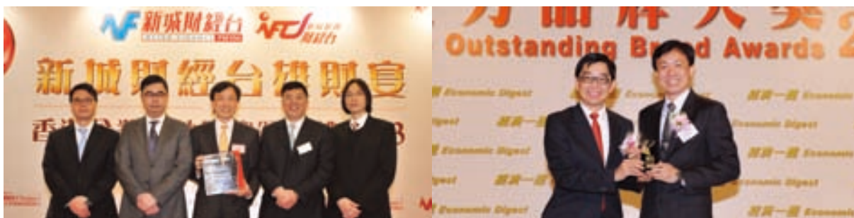
1 本集團連續6年榮獲《香港企業領袖品牌》之「卓越工商舖物業代理品牌」殊榮 2 「經濟一週」頒授「2012年實力品牌大獎」，突顯本集團非凡實力。