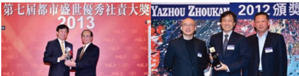
3 本集團一向竭力履行企業社會責任，本年更首奪「都市盛世優秀社責大獎」。 4 本集團獲「亞洲週刊」推選為2012年度「亞洲卓越品牌」。