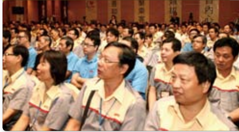
九巴為超過一萬名營運及維修員工籌辦一項名為「服務乘客、從心出發」的大型培訓計劃