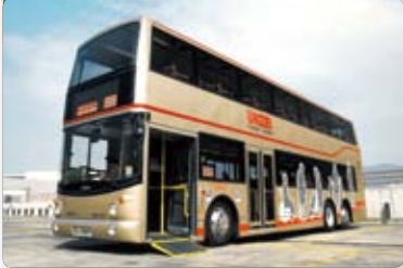
九巴引進全球首部方便輪椅上落的超低地台雙層巴士