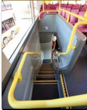
九巴引入採用筆直梯級設計的新一代巴士