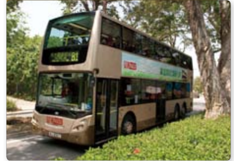
九巴引進亞洲首部歐盟第五代空調雙層巴士