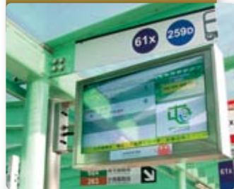
屯門公路轉車站設有巴士到站時間預報系統