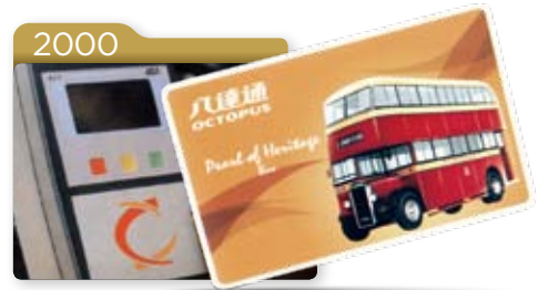
九巴全線巴士安裝八達通卡電子繳費系統