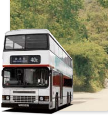
九巴為旗下巴士安裝歐盟第一代環保引擎