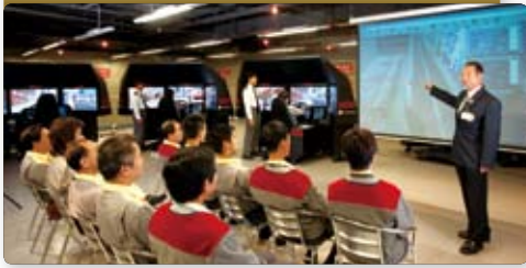
九巴引進香港首個模擬駕駛室，以提升車長的訓練質素