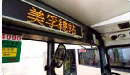
九巴推出車廂電子報站系統