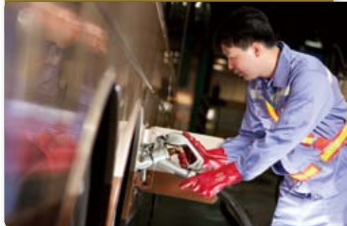
九巴採用含硫量近乎零的柴油