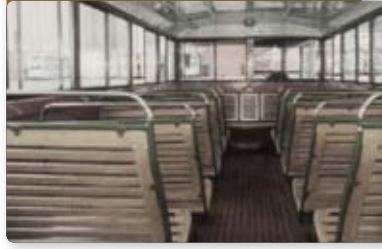
早期巴士的車廂設有木條座椅