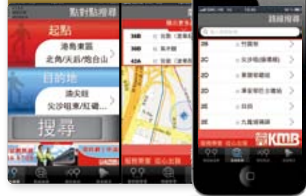
九巴為推出智能手機應用程式以提供巴士資訊的先行者