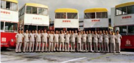
九巴於沙田設立車長訓練學校