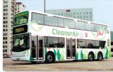
九巴投入全港首部配備歐盟第三代環保引擎的巴士