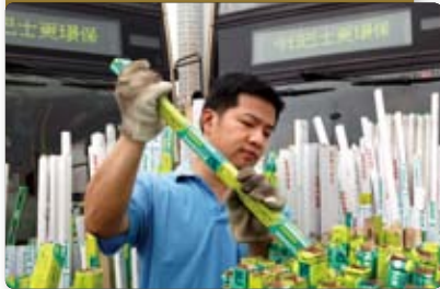
九巴成為全港首間參與光管回收計劃的企業