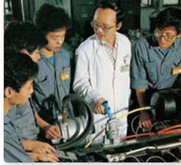
九巴成立技術訓練學校