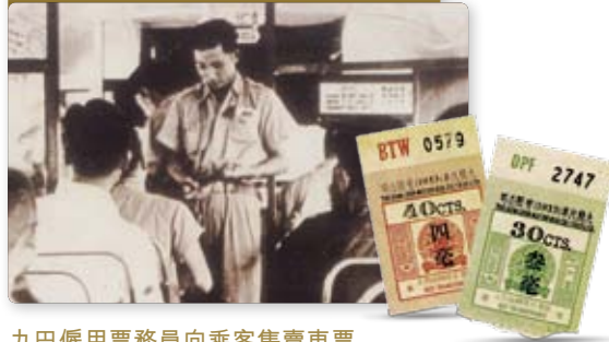
九巴僱用票務員向乘客售賣車票