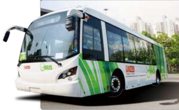
香港首部零排放超級電容巴士(或稱「gBus」)進行測試