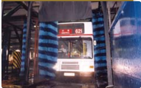
為清洗巴士機安裝污水循環再用系統