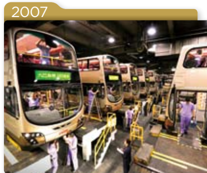
2007 九巴獲香港工業總會轄下的香港優質標誌局頒發證書，表揚九巴位於荔枝角、沙田、九龍灣及屯門的四所主要營運車廠，均符合香港Q嘜環保管理計劃所規定的環保管理標準