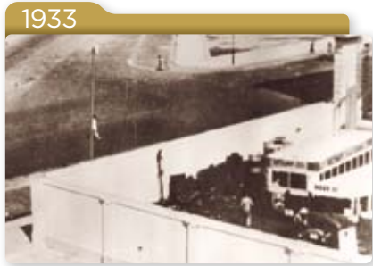
1933 九巴位於彌敦道北端的首個車廠正式啟用