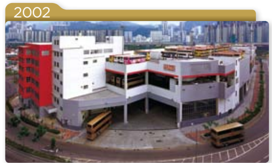
2002 九巴於荔枝角新建的環保車廠落成啟用