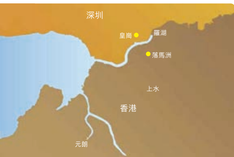
● 新港巴的巴士總站

自落馬洲支綫、落馬洲公共運輸交匯處及深港西部通道啟用後，新港巴面對來自鐵路和公共小型巴士服務的激烈競爭。此外，皇崗管制站搬遷後，旅客需要前往更遠的地點辦理出入境手續，對載客量的增長構成影響。因此，新港巴的跨境巴士服務需求下跌，載客量由2011年的520萬人次下跌至2012年的490萬人次。