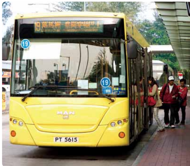
新港巴為往返落馬洲與皇崗的乘客提供方便快捷的服務

新港巴的目標是透過提供方便及優質的服務，使其穿梭巴士服務繼續成為顧客首選的跨境交通工具。