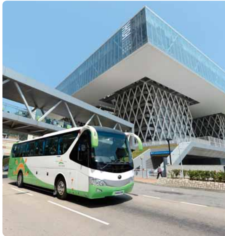
陽光巴士為各類顧客提供合適的客運服務

年內，陽光巴士集團繼續採購市場上最先進的環保巴士，以加強其服務。集團車隊於2012年加入了25部歐盟第五代巴士，以取代較舊的巴士。陽光巴士集團亦收購了兩家擁有合共17部巴士的跨境非專營巴士營運商。陽光巴士集團擴大車隊規模，反映該集團開拓跨境巴士服務等業務範疇的策略。陽光巴士集團將繼續引進更多新型的歐盟第五代巴士，以配合車隊提升計劃。於2012年年底，陽光巴士集團的車隊擁有394部巴士。