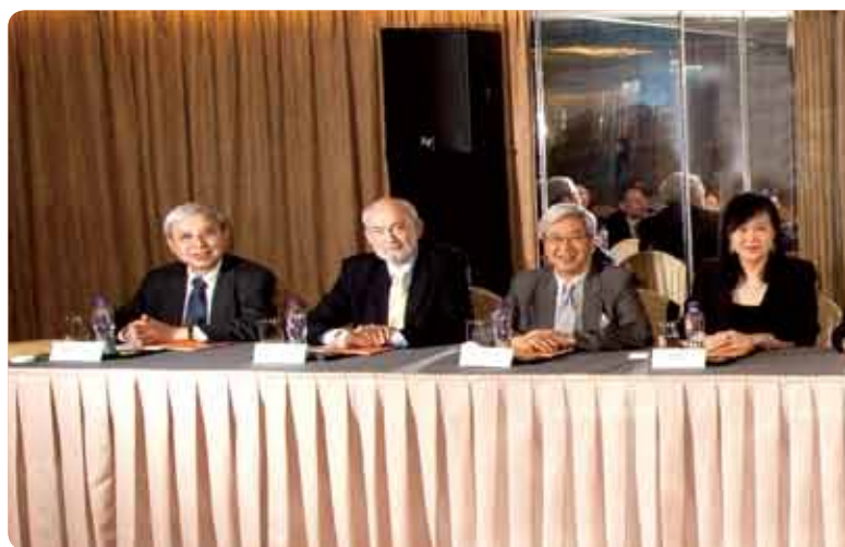
在 2012 年股東週年大會上，載通國際董事與股東會晤