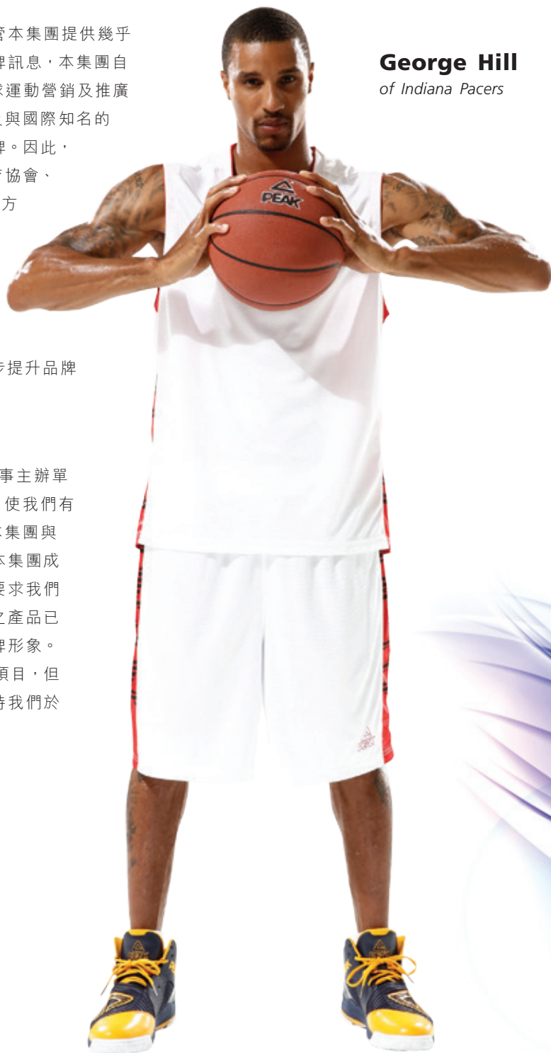
George Hill of Indiana Pacers

本集團贊助的各類籃球推廣夥伴，例如聯會、聯盟、隊伍、賽事主辦單位及運動員個人，是本集團品牌推廣及營銷策略的核心部分，使我們有別於同行，而專注策略亦向消費者展示出明確之品牌理念。本集團與全球大部分頂尖知名的籃球推廣夥伴已建立了夥伴關係，使本集團成功建立了一個於中國同業中最國際化的籃球品牌形象。我們要求我們之代言籃球員於所有賽事穿上我們的籃球鞋，在在證明我們之產品已通過功能及性能之最嚴格測試，並進一步提升我們的專業品牌形象。儘管本集團在新的市場策略下開始推廣籃球以外的其他運動項目，但我們將繼續致力在籃球運動投放大部分資源，從而在來年維持我們於籃球領域之領導地位。