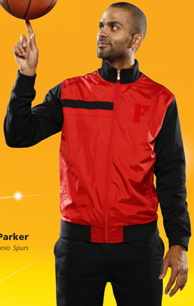
Tony Parker of San Antonio Spurs