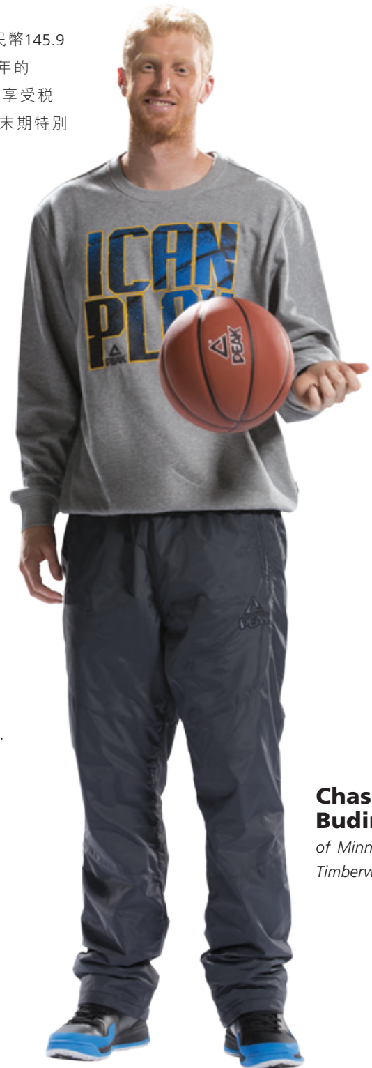
Chase Budinger of Minnesota Timberwolves

由於2013年本集團的分銷商受到體育用品行業整合的困擾，加上疲弱的需求，所以本集團容許部份分銷商以較長時間清付貨款。因此，平均貿易應收賬款及應收票據週轉天數由截至2012年12月31日止年度的127天增加至截至2013年12月31日止年度的135天。