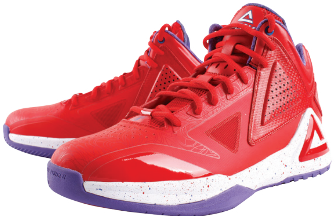
“TP 9” 籃球鞋

於中國地區的每個匹克授權經營零售網點的平均面積由2012年12月31日的86.7平方米增加至2013年12月31日的90.1平方米，這與本集團逐步增加新網點面積以放置不斷增加的產品和配合本集團已提升的品牌形象策略一致。相對於2012年而言，於2013年在中國地區的每個匹克授權經營零售網點的平均營業額及每單位零售面積的平均營業額分別下降了5.4%及11.6%。