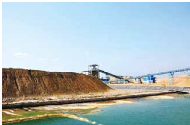
Muliashi項目噴淋後浸出液