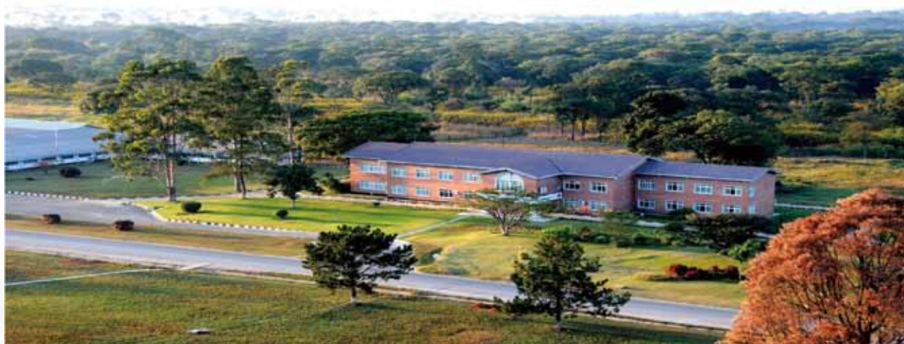
綠樹叢中的中色非洲礦業中心辦公樓

於2013年，本集團的銷售成本為1,469.8百萬美元，較2012年的1,249.4百萬美元增加17.6%。主要原因是粗銅銷量的增長帶來成本總額的增加，同時部分被國際銅價的下跌所抵銷。