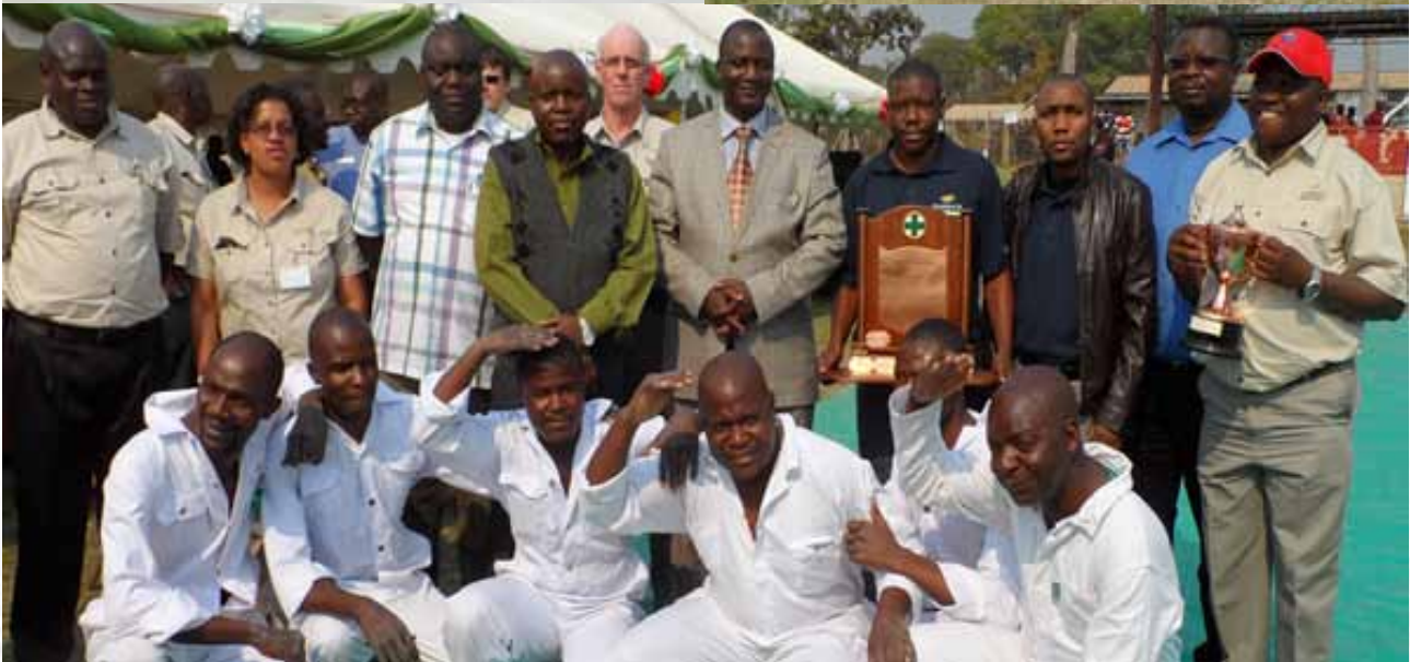
中色非洲礦業代表隊蟬聯2013年礦山緊急救援競賽冠軍後與主辦方及裁判合影