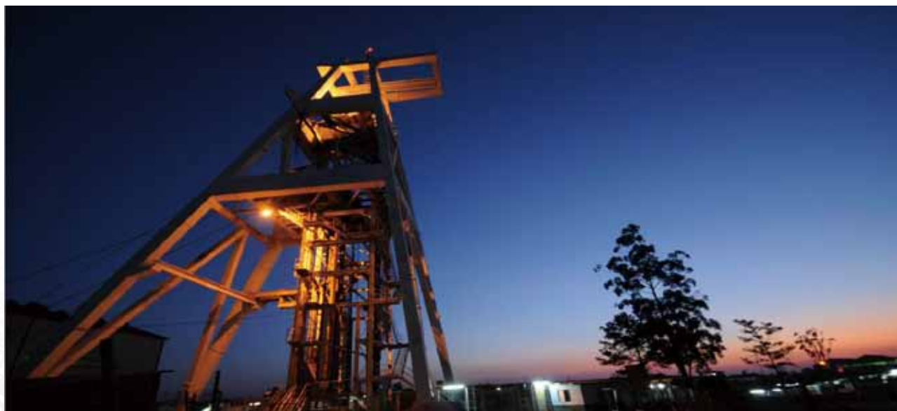
晨曦下的Chambishi銅礦主礦井