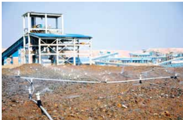
Muliashi項目堆浸系統1號堆場噴淋作業

本報告資源量及／或儲量的年度更新所採納的假設採用2012年招股章程所採用之同一標準JORC準則，在沿用了技術顧問所使用的歷史資料的基礎上根據新的勘探工作做了相應更新。資源量及／或儲量已經由內部專家確定沒有重大變化，主要變化為生產消耗及加密勘探之後帶來的調整。