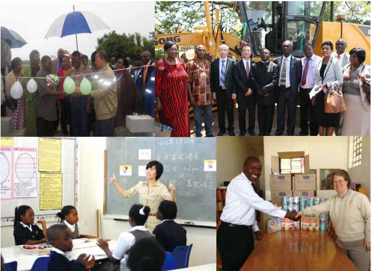
中色盧安夏信託學校志願者在教授中文

謙比希銅冶煉向贊比亞謙比希鎮捐贈醫生及護士住房 中色非洲礦業向當地市政廳捐贈平路工程車