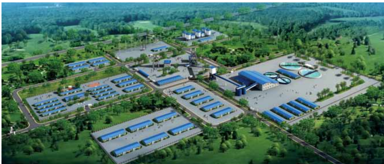
Chambishi銅礦東南礦體採選工程鳥瞰圖