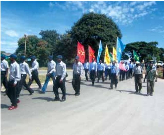
謙比希銅冶煉公司員工參加市政五一勞動節遊