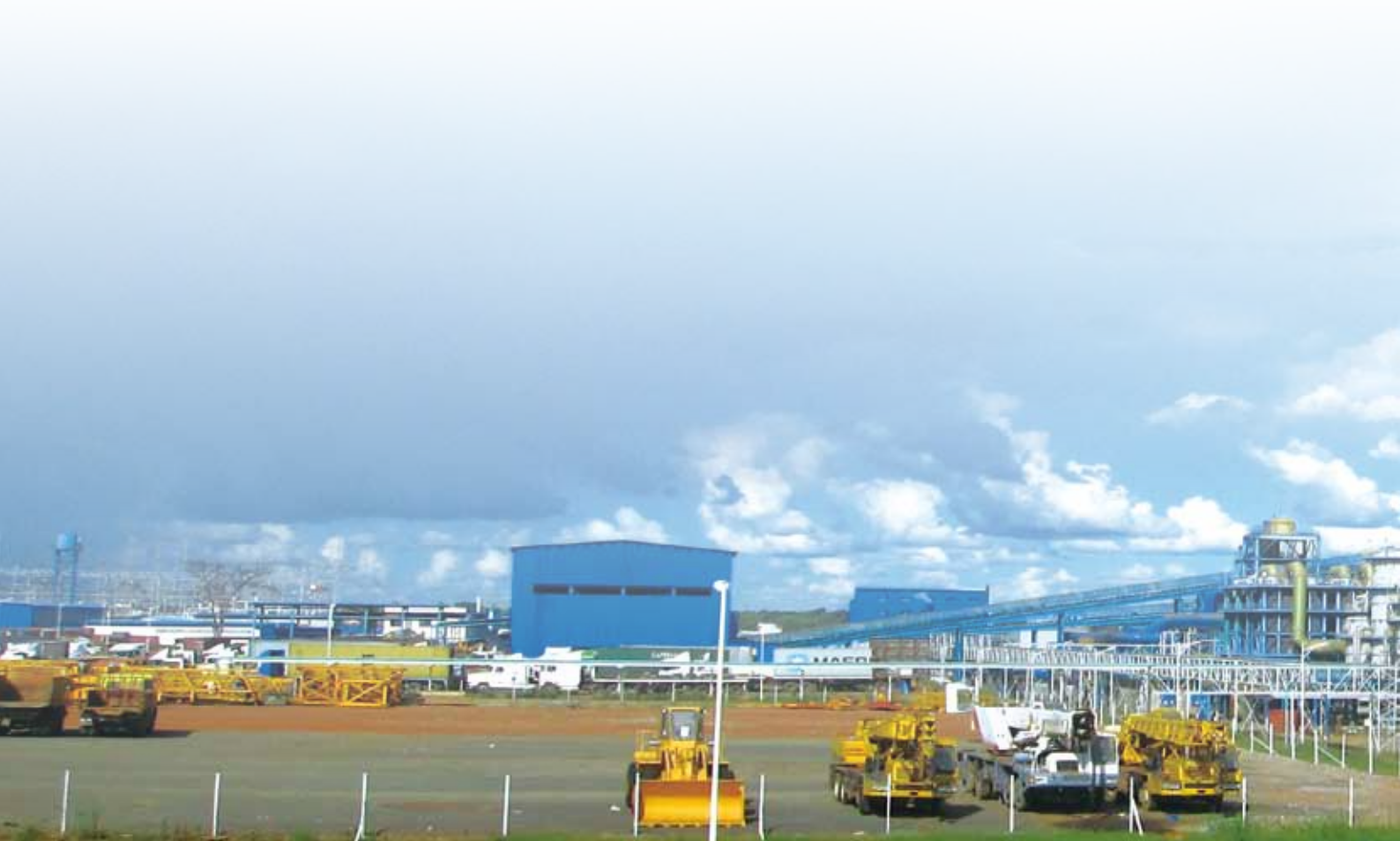
謙比希銅冶煉公司全景

2014年本集團將繼續進一步加大地質勘探和開發投入，高度重視和加大勘探區和現有生產礦山的周邊、深部的找礦力度；與此同時，本集團將繼續在銅資源豐富的贊比亞及剛果（金）等地區尋找合適的收購目標，擴大集團的資源量。