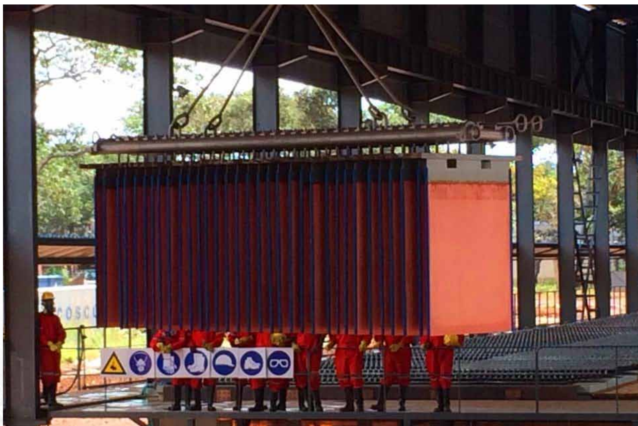
馬本德項目工人吊裝陰極銅產品（2014年3月生產第一批產品）

謙比希濕法冶煉通過中色馬本德濕法建設及經營一個年產陰極銅20,000噸的濕法廠項目（「馬本德項目」）。馬本德項目已經於2013年底基本完成了基建工作，並開始單體試車工作。