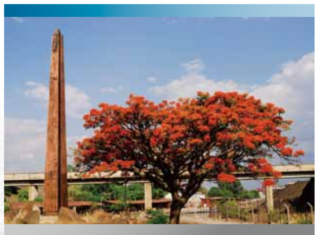
盧安夏銅礦發現紀念碑