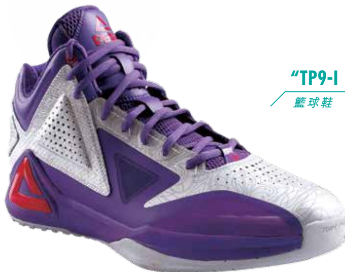
“TP9-I ALL STAR”

我們根據學歷、表現、年資等因素釐定員工之薪酬。我們通常於每年年底向員工發放花紅，作為獎勵彼等對本集團作出之貢獻。本公司向表現突出之員工授出購股權，作為向員工提供之額外獎勵。