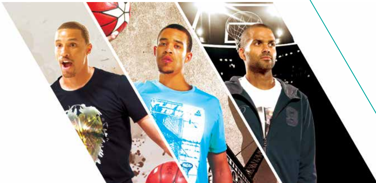
GEORGE HILL Indiana Pacers