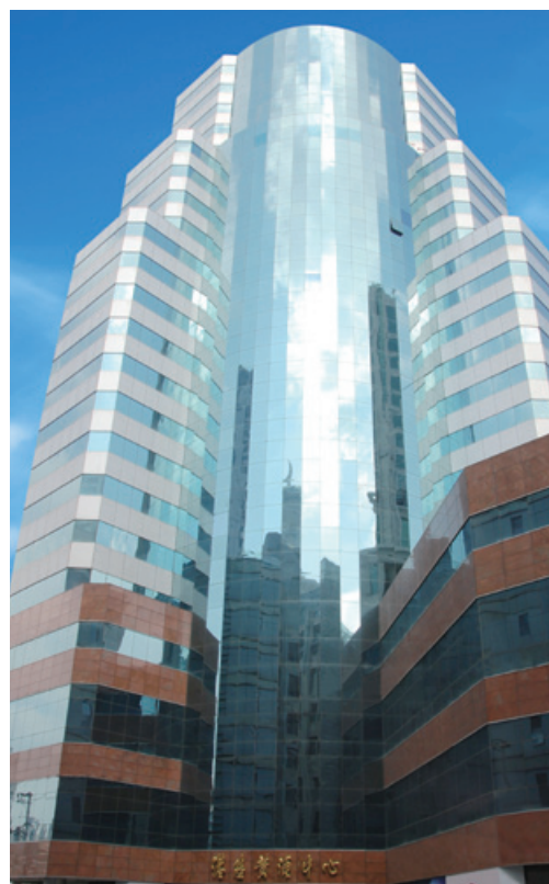
上海港陸黃浦中心

本集團之收入及經營成本乃按港幣及人民幣計算。本集團亦承受其他貨幣變動風險，主要為按美元計算之銀行存款及可供出售之財務資產。