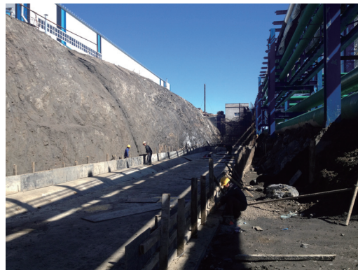
已完成棧橋的技術連接