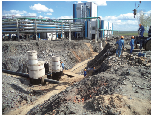
正如火如荼進行的地下管道工程