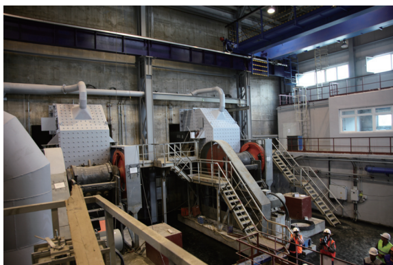
主要粉碎台已準備進行冷調試