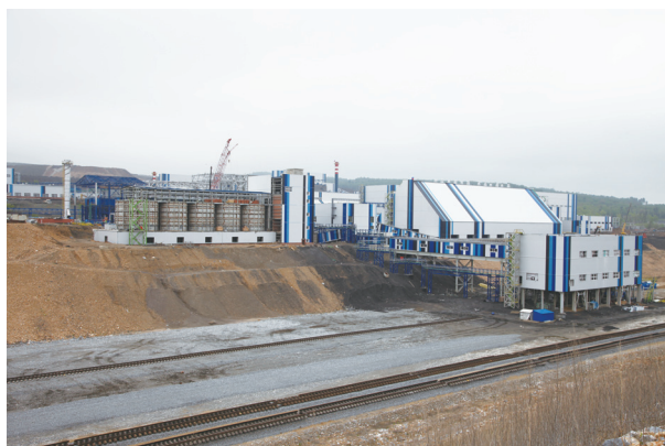
K&S廠房的外部相片，顯示鐵路連接