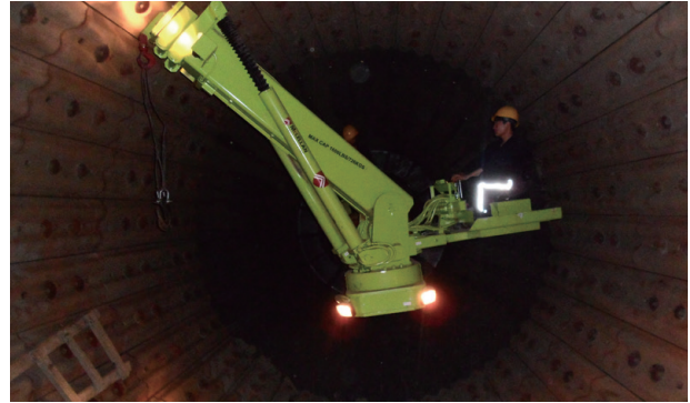
已安裝球磨機襯板