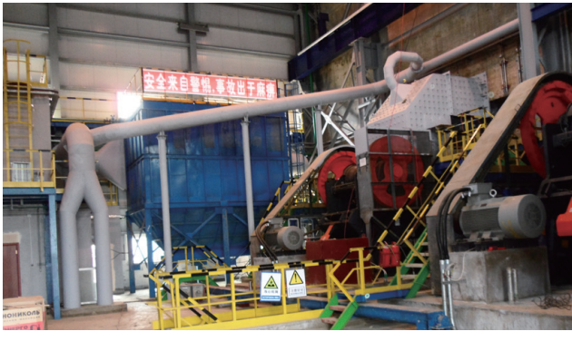
研磨及篩選加工廠可準備進行熱態投產