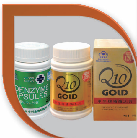
輔酶Q 10 片/ 膠囊