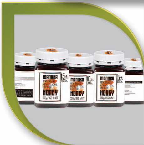
康培爾 麥努卡蜂蜜