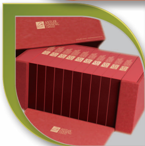
中生牌鹿茸 洋蔘膠囊