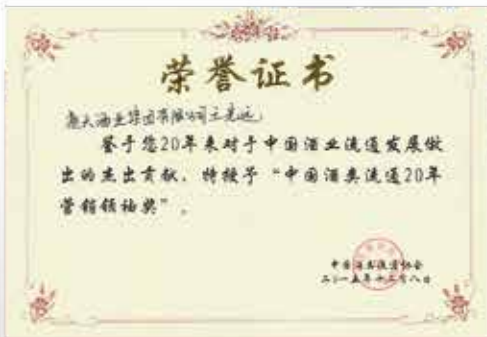
王光遠(中國通天酒業集團 有限公司主席及行政總裁): 中國酒類流通20年營銷領袖獎