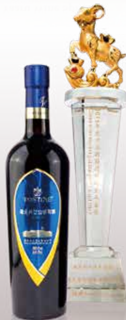
「通天利口山葡萄酒」榮獲 「2015年度中國葡萄酒市場 金羊金獎」