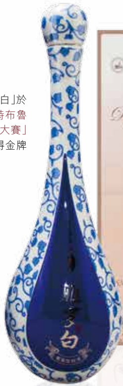
「雅羅白」於 「2015年比利時布魯 塞爾國際烈性酒大賽」 中奪得金牌