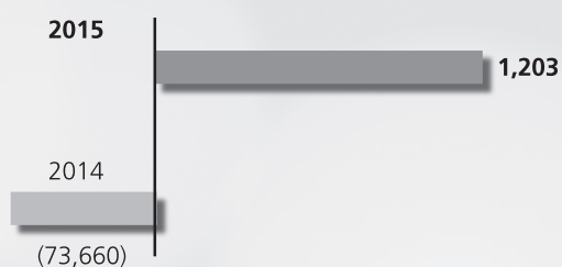
年內溢利／(虧損) (千港元)