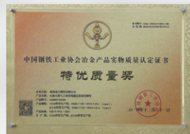
2014 特優質量獎 (直縫埋弧焊管) (中國鋼鐵工業協會)