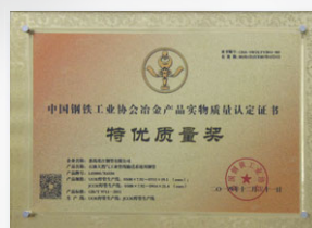
2014 中國冶金產品實物質量特優質量獎 (中國鋼鐵工業協會)