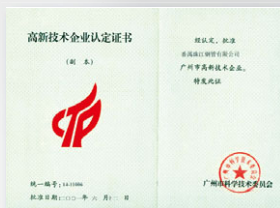
2001 高新技術企業認定證書 (廣州市科學技術委員會)