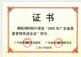
2006 2005年廣東省質量管理 先進企業 (廣東省質量技術監督局)