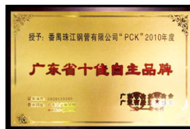
2011 廣東省十佳自主品牌 (廣東省企業聯合會、廣東省企業家協會)