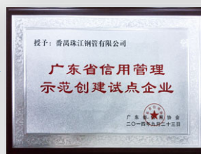
2014 廣東省信用管理示範創建試點企業2014 (廣東省信用協會)