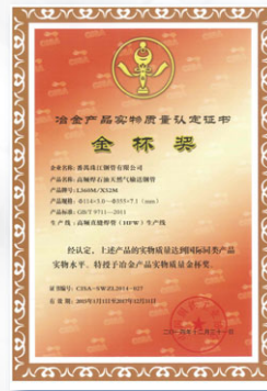
2005/2011/2012/2015 續 冶金產品實物質量 金杯獎(高頻埋弧焊管) (中國鋼鐵工業協會)