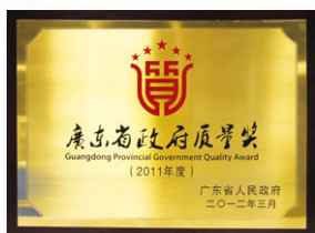
2012 廣東省政府質量獎 (廣東省人民政府)