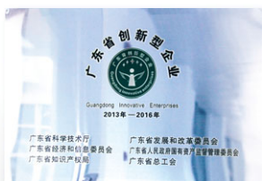
2013-2016 廣東省創新型企業 (廣東省科學技術廳、廣東省發展和改革委員會、廣東省經濟和信息委員會、廣東省人民政府國有資產監督管理委員會、廣東省知識產權局、廣東省總工會)