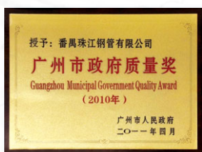
2011 廣州市政府質量獎 (廣東省人民政府)