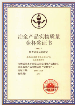
1997 冶金產品實物質量 金杯獎 (中國冶金工業部)