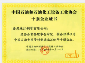
2004 中國石油專用管材製 造業2004年十強企業 (中國石油和石化設備工 業協會)