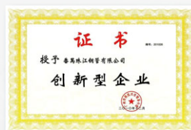
2010 廣州市創新型企業 (廣州市科技興市領導小組)