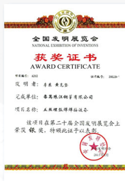
2011 第二十屆全國發明展覽會銀獎—五絲埋弧埋弧焊接設備 (中國發明協會)