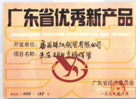
1996 廣東省優秀新產品 (廣東省經濟委員會)