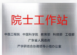
2011 院士工作站 (廣東省人民政府)