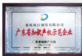
2011 廣東省知識產權示範企業 (廣東省知識產權局)