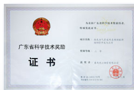
2013 廣東省科學技術獎勵 (廣東省人民政府)