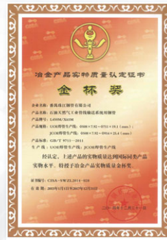
2005/2011/2012/2015 續 冶金產品實物質量 金杯獎(直縫埋弧焊管) (中國鋼鐵工業協會)