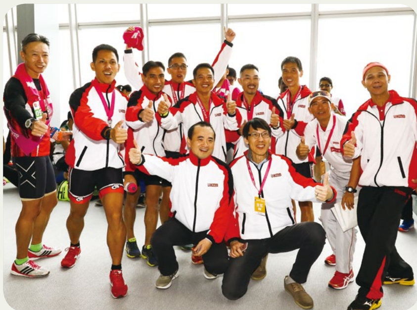
九巴接力隊參加「新地公益垂直跑—勇闖香港 ICC」賽事