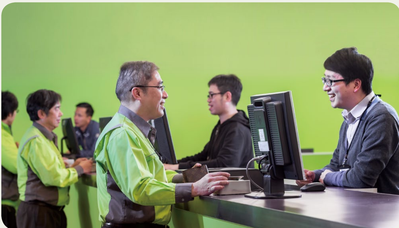
我們改善工作環境，使員工有愉快心情