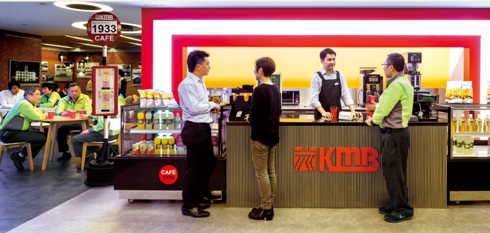
我們提供休息室及茶點區，讓員工補充精力應付一天的工作