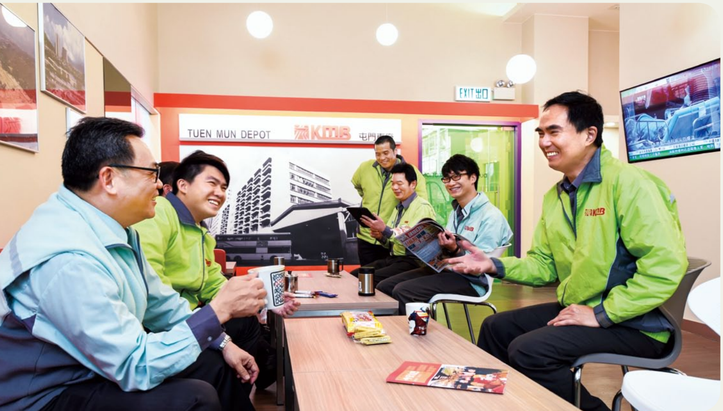
我們翻新休息室，為前線員工提供應有的休息空間

2015年，我們再次舉辦長期服務獎頒獎典禮，以表揚資深員工的忠誠服務。共有252名僱員獲頒35年服務獎連同一面金牌，164名僱員獲頒30年服務獎連同獎牌及襟針，355名僱員獲頒20年服務獎連