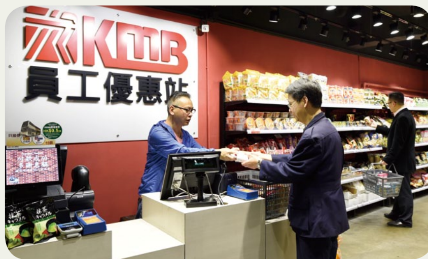
我們的員工優惠站深受員工歡迎