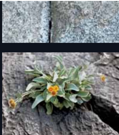
003 VITALITY 生命力