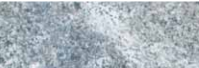
001 VITALITY 生命力