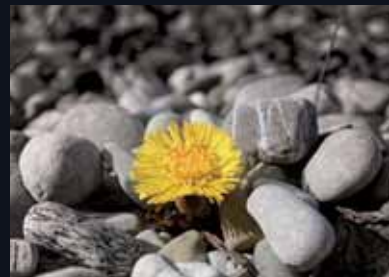
005 VITALITY 生命力