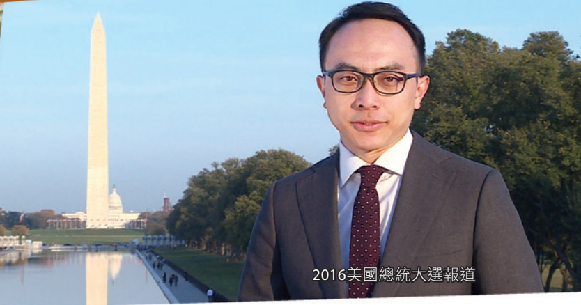
2016美國總統大選報道