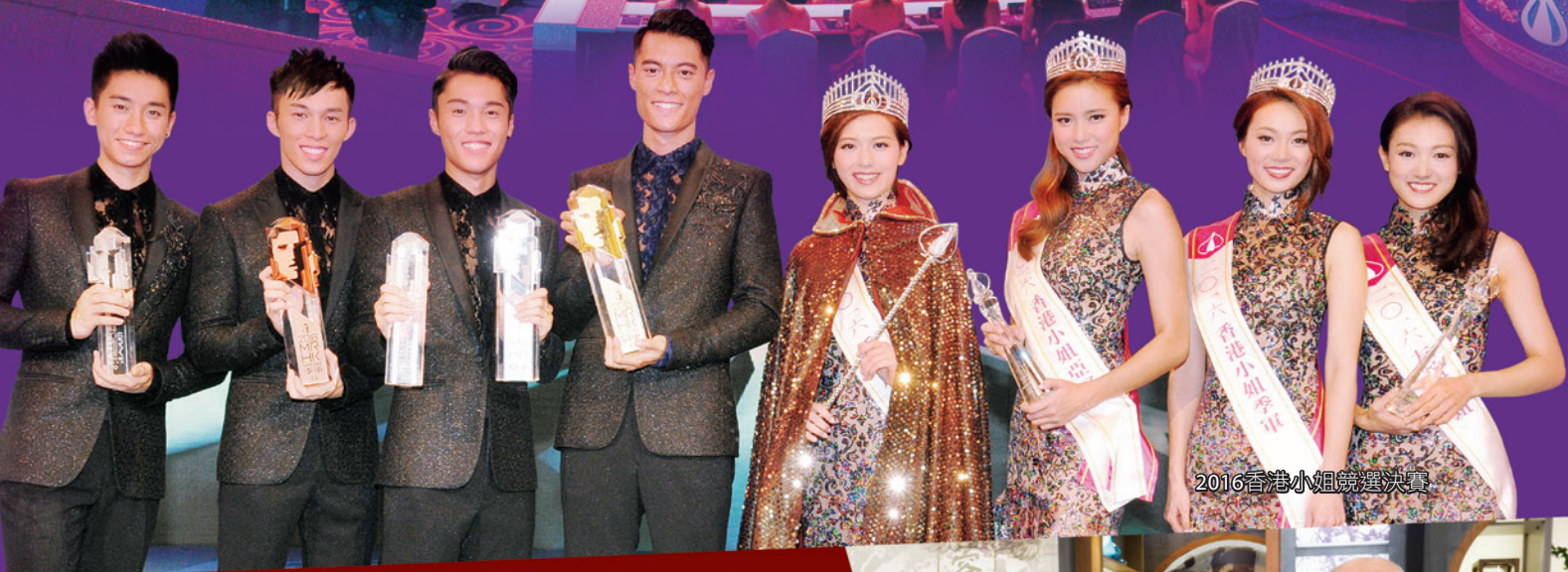
2016香港小姐競選決賽