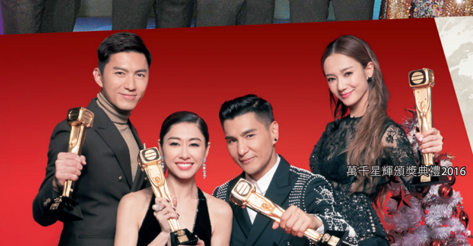
萬千星輝頒獎典禮2016