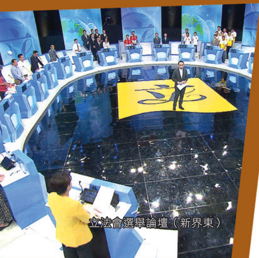
立法會選舉論壇（新界東）