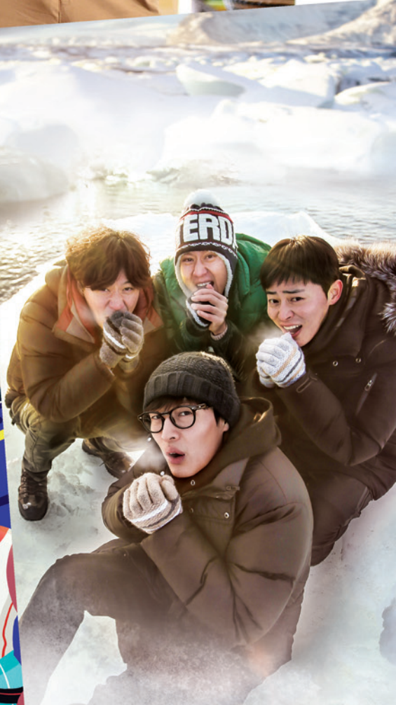
花樣青春 II - 冰島篇