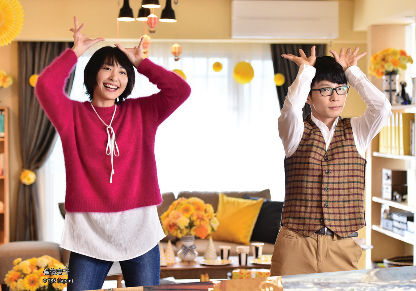
僱傭妻子