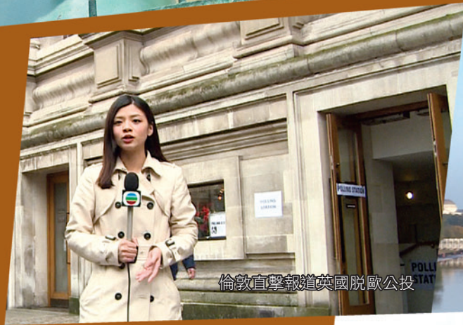
倫敦直擊報道英國脫歐公投