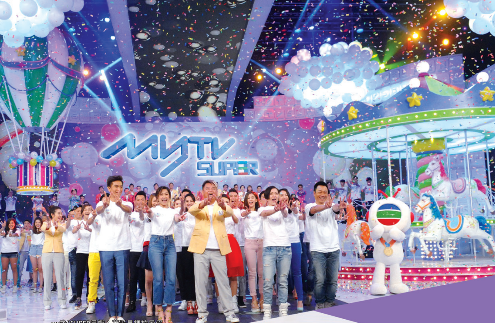
myTV SUPER呈獻：萬千星輝放暑假