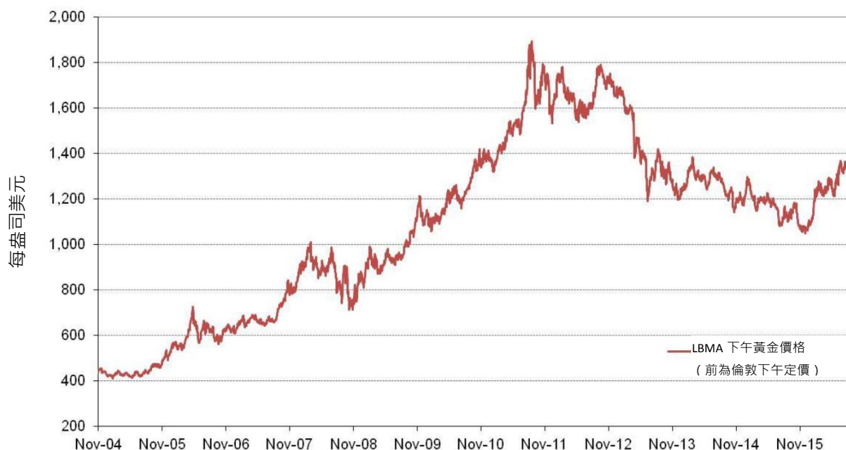
每日金價 - 2004年11月18日至2016年9月30日