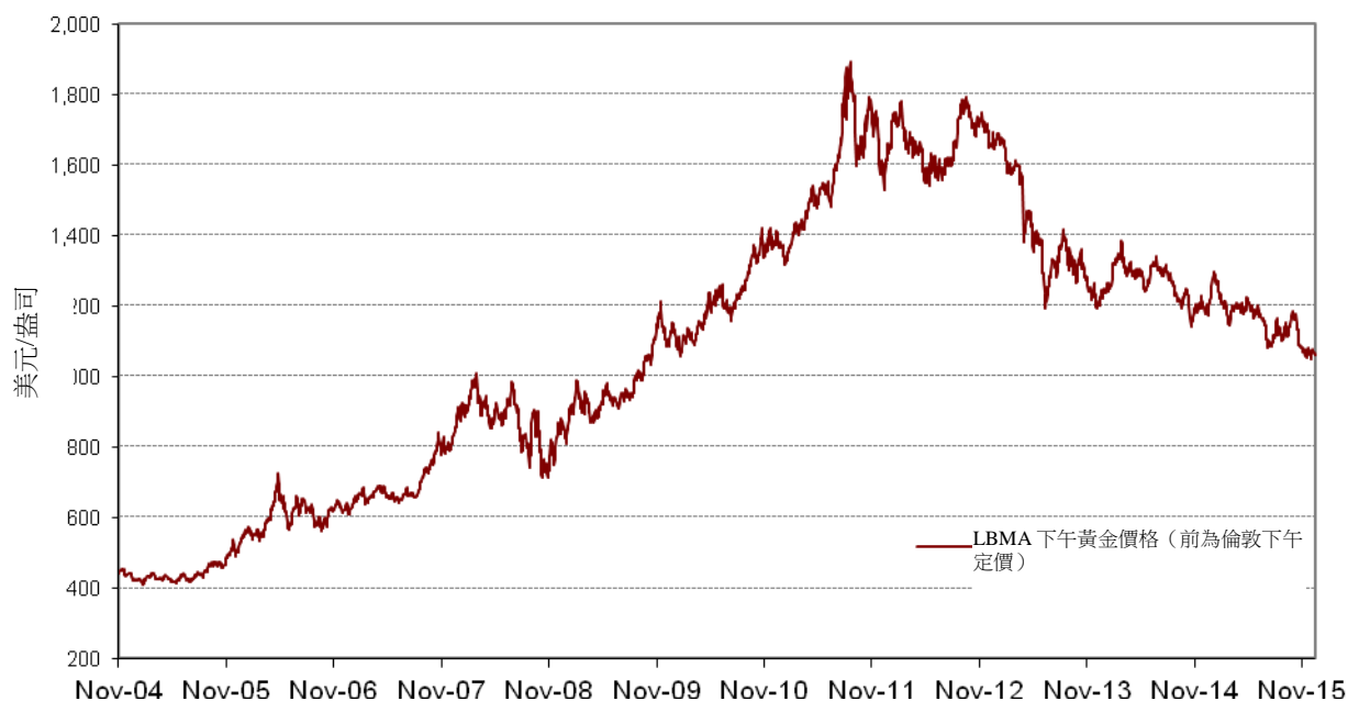
每日金價 — 2004年11月18日至2015年12月31日

下圖提供黃金價格的歷史背景。圖表闡明由2004年11月18日股份開始在紐約交易所買賣之日起至2015年12月31日期間每盎司美元黃金價格的變動，並自2015年3月20日起以LBMA下午黃金價格為基準，而先前則以倫敦下午定價為基準。