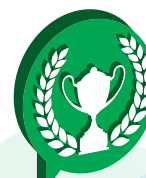
ISO 14001 環境管理系統 認證