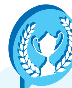
ISO 50001 能源管理系統 認證