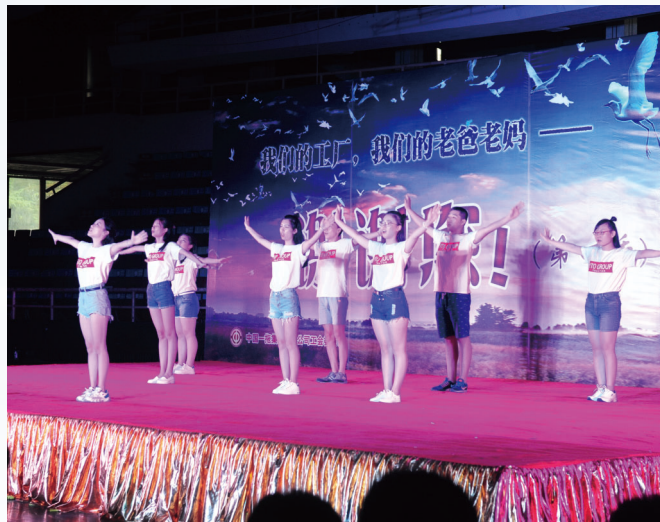
公司開展「我們的老爸老媽、我們的工廠，謝謝您」主題感恩活動

公司持續開展「情系東方紅」關愛行動，一是組織2017年考入大學的258名職工子女開展「我們的老爸老媽、我們的工廠，謝謝您」主題感恩活動，參觀體驗父母工作的崗位，每人發放「東方紅」行李箱，對30名職工子女發放「東方紅」未來基金，共12萬元；二是組織在大學就讀的職工子女參加暑期打工活動，引導參與活動的職工子女樹立勞動觀念，通過自己的勞動掙得人生的第一份薪酬；三是「愛心媽咪小屋」正式揭牌並投入使用，為處於孕期、哺乳期的女職工提供便利、舒適、溫馨、私密的休息場所。