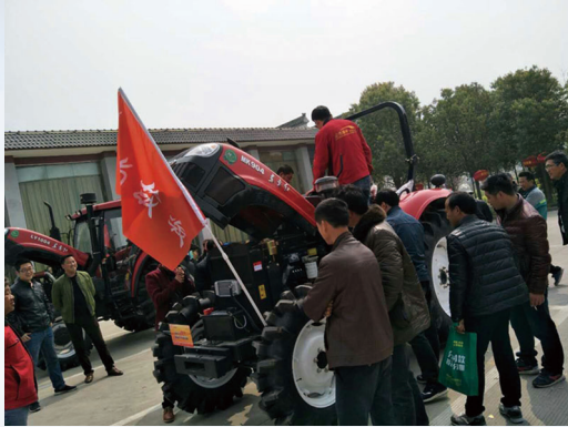
公司把握用戶需求變化，加快新產品推廣應用

2017年，公司大中型拖拉機實現銷售4.83萬台，行業位勢保持第一；柴油機配套銷量10.36萬台，在農用非道路機械配套領域保持領先地位。