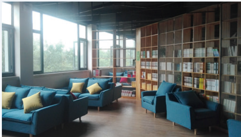
公司「幸福10號」現代生活服務平台(幸福書屋內景)

2017年度公司圍繞員工需求，有效整合各方資源。一是打造「幸福10號」現代生活服務平台，新推出幸福書屋、老年大學、心理諮詢中心、瑜伽館、乒乓球館等服務項目；二是做好新增7.9萬㎡暖氣安裝工程的協調工作，擴大供暖覆蓋面；三是為全體在冊員工幼兒入託優惠20%的保教管理費。