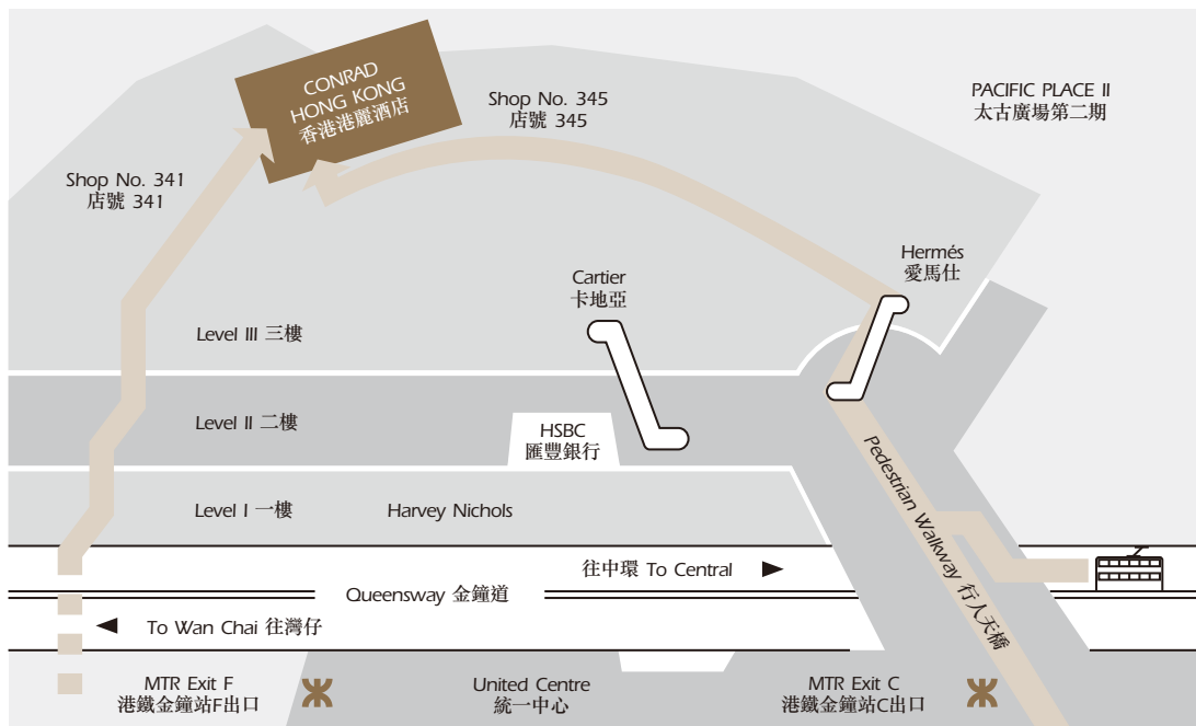
From MTR Admiralty Station to hotel 由金鐘港鐵站前往酒店