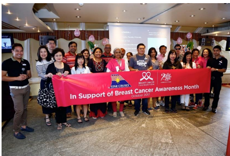
我們支持 2017 年 10 月的國際乳癌關注月，以提高公眾對乳癌的認識。

十月，雲頂香港有限公司於新加坡支持國際乳癌關注月，為我們的客戶和員工舉辦乳癌認知講座。