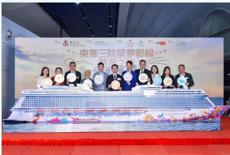
星夢郵輪與東華三院共同組織慈善之旅，為東華三院全方位發展基金募集資金。