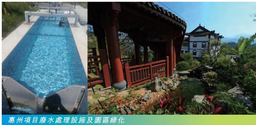
惠州項目廢水處理設施及園區綠化

本集團一般採用超濾(UF)、納濾(NF)及逆滲透等技術進行廢水處理。由於垃圾焚燒設備需要大量冷卻用水，經過回收處理而來的中水大部分相關冷卻用途或園區本身的綠化，減少了排放到市政管道的污水量。本集團部分項目如位於惠州的惠陽環保園，便透過處理及回收利用廢水達至「污水零排放」。