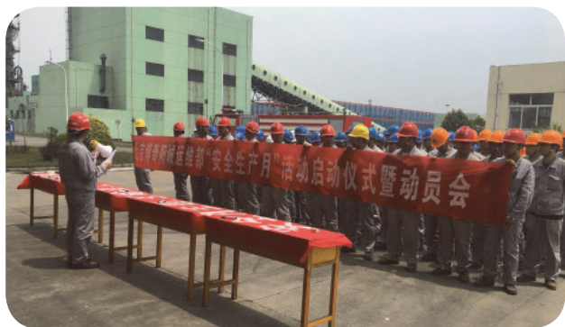
9月13日 開展2017年秋季安全質量大檢查