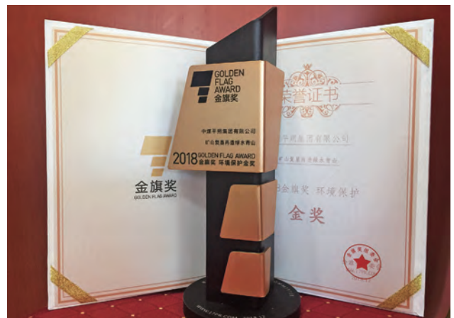
2018金旗奖环境保护金奖

加强社会责任沟通。 从2009年发布第一份社会责任报告起，中煤能源至今已连续十年发布社会责任报告，两次获得“央视财经50指数·十佳社会责任公司”荣誉。2018年，中煤能源荣获“中国上市公司社会责任建设100强”荣誉，中煤平朔集团“矿山复垦再造绿水青山”社会责任案例荣获“2018金旗奖环境保护金奖”，被评为“2018年度环保社会责任企业”。