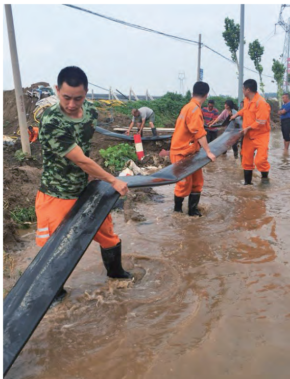
上海能源公司抗洪救援队

立方米、连接排水管路1,640米、铺设电缆616米、抢救大棚12个……圆满完成了救援任务。