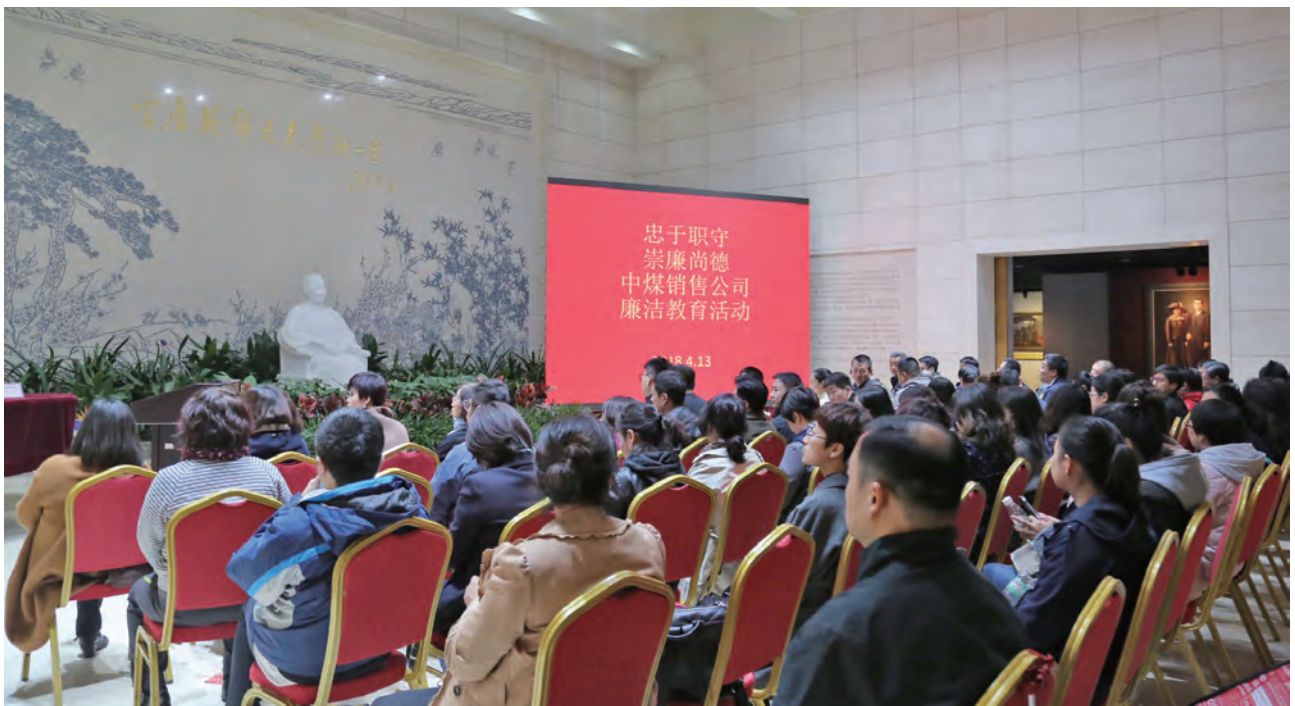
中煤销售公司开展廉洁教育活动

透明运营。 公司制定了信息公开工作方案，明确了信息公开的原则、内容、程序和工作计划。针对员工和社会关注的招聘、采购、招标、干部任用等热点问题，公司坚持计划公开、过程公开、结果公开，接受社会监督，杜绝暗箱操作。坚持厂务公开制度，通过职代会、公告栏、意见箱等方式，定期公开企业重大事项、领导干部职务消费情况、资产财务情况，鼓励员工建言献策、参与企业管理。公司每年通过企业网站、报纸、社会责任报告、企业年报等媒介和载体，及时公布公司经营发展情况，主动回应社会关切。公司建立新闻发言人制度，及时答复媒体及投资者问题，建立了良好的沟通机制。