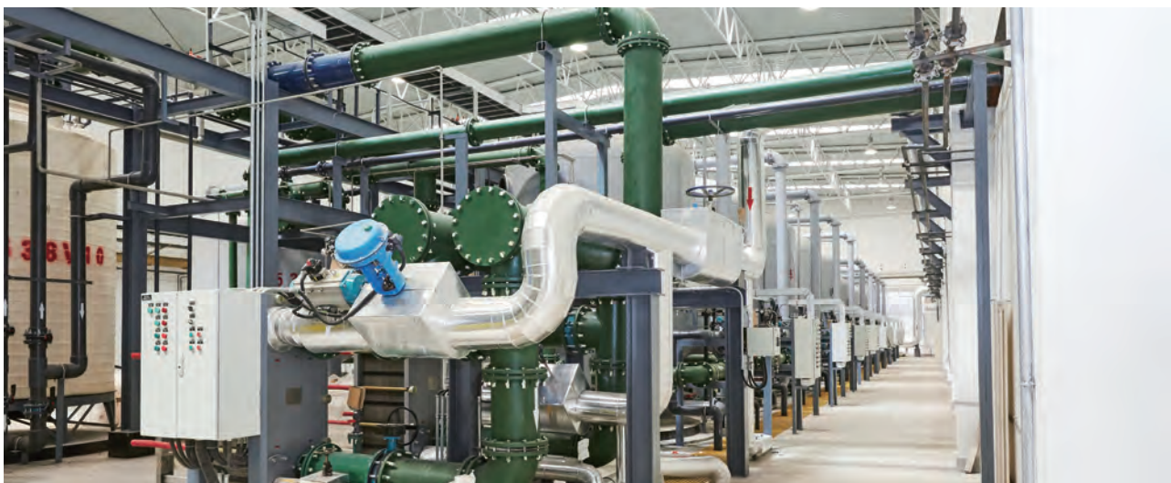
矿井水深度处理工程

公司废水排放主要是煤矿、煤化工企业，主要污染物为化学需氧量和氨氮，执行的排放标准为《煤炭工业污染物排放标准》(GB20426-2006)、《污水综合排放标准》(GB8978-1996) 和《地表水环境质量标准》(GB3838-2002) III类标准等。公司根据矿井水、工业废水、生活污水等不同水质特点和回用途径采取相应的处理工艺，在满足排放标准的基础上，不断提高废水资源化利用水平。公司在鄂尔多斯地区的煤炭、化工企业对矿井水进行深度处理利用，为矿井水“无害化、资源化、全复用”奠定了基础，实现了矿