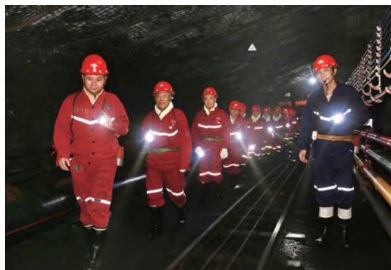
安全生产标准化建设

高要求提升标准。上海能源公司大力加强基础、基层、基本功“三基建设”，全面贯彻技术、管理、岗位工作“三大标准”，以新标准为引领，不断提升安全生产标准。坚持对各矿标准化工作每月一次动态检查，每季度一次静态检查，平时紧盯管理现场进行专项检查，不断提升安全生产标准化水平。