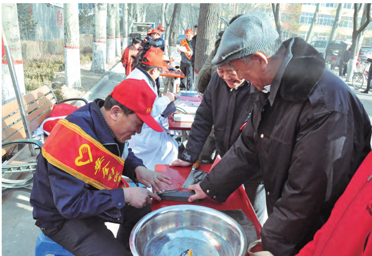
开展志愿者服务活动

中煤能源热心社会公益，支持并鼓励员工参与形式多样的志愿者服务活动，经常性地开展“传真情、送温暖、献爱心、一帮一、结对子”等义务活动，通过力所能及的行动，为当地的困难户，特别是为老年人以及其它需要帮助的人群送去关爱和温暖，向社会传递正能量。