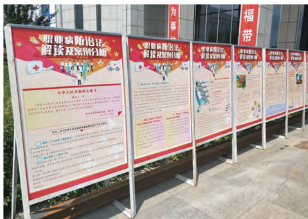
职业健康宣传教育培训

加强体检监护，保障职业健康。严格按照规定对接触职业危害的员工进行职业健康体检，远离职业危害。坚持职业健康“三同时”建设，做到煤矿、电力及煤化工建设项目职业危害防护设施与主体工程同时设计、同时施工、同时投入生产和使用，切实保护劳动者的职业健康。