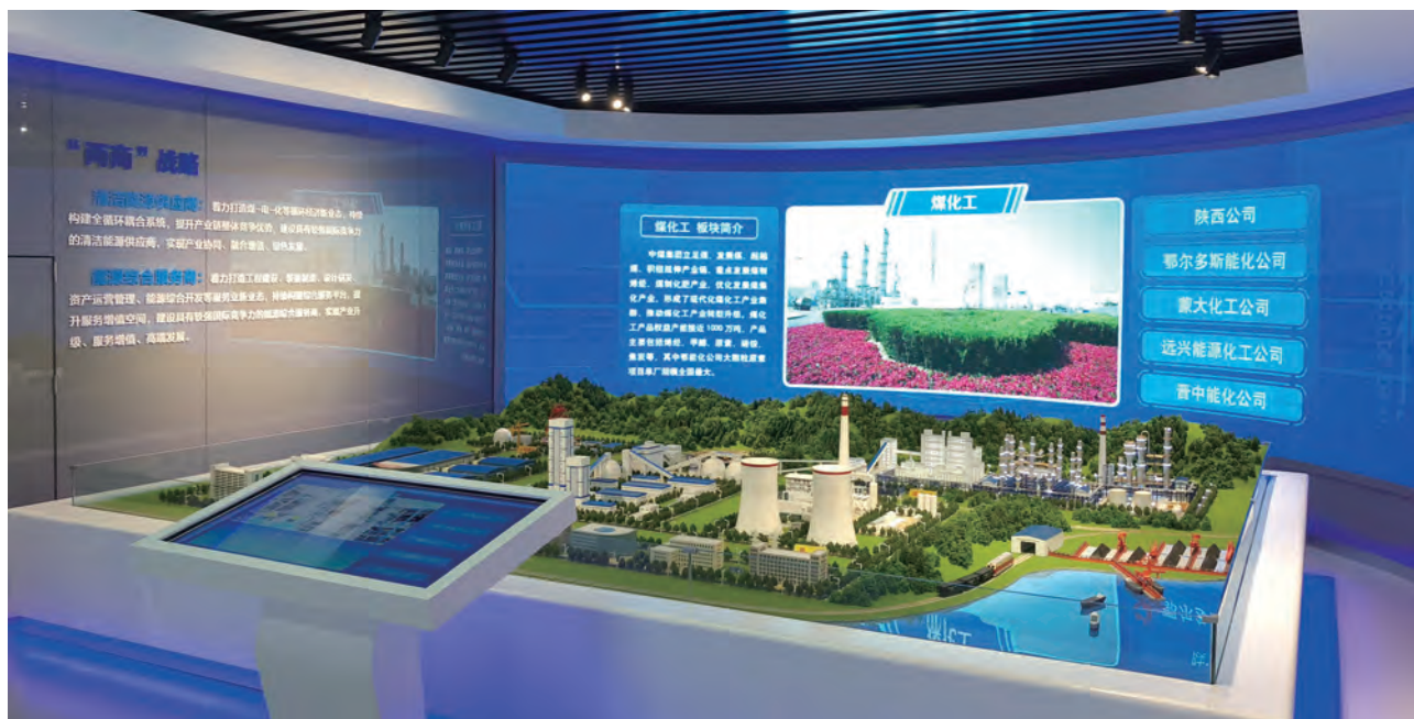
中煤能源产业沙盘

公司所属中国煤矿机械装备有限责任公司是国内规模最大、产品成套服务最全的煤矿装备制造企业，在国内率先形成煤矿综采综掘装备成套研发、制造和供应能力，建成国际领先水平的煤机装备试验平台，为煤矿装备水平提升、煤矿装备国产化和煤炭行业技术进步起到积极的推动示范作用。