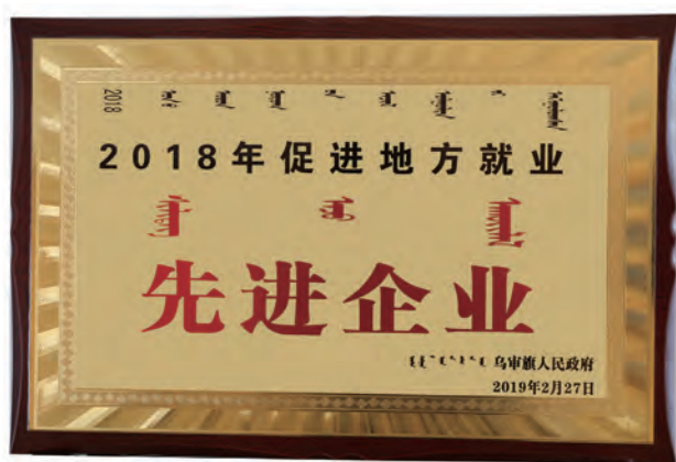
“促进地方就业先进企业”奖牌