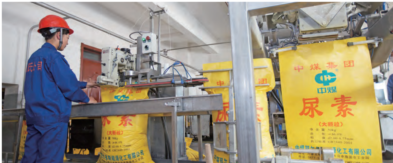
中煤大颗粒尿素产品

装备公司严抓产品质量管理，加强生产过程控制，严格兑现质量奖惩，不断提高全面质量管理水平。2018年，装备公司主要生产企业相继通过了国际焊接质量管理体系、QEO三体系审核和CNAS实验室监督评审、EN1090钢结构产品认证年度监督审核，企业质量管理规范运行能力、生产制造质量保障能力持续加强。装备公司2018年质量损失同比降低18.4%。各级管理和技术服务人员深入用户现场，了解产品运行情况，打好售后服务和产品质量改进“主动仗”。积极开展用户满意度调查，做好用户主机产品摸底、登记，就设备型号、工况、用户反馈、整改方案、负责人、回访记录等进行统计梳理，建立内部用户售后服务统计台账，定期跟踪用户反馈，督促改进工作，进一步提升了服务水平。