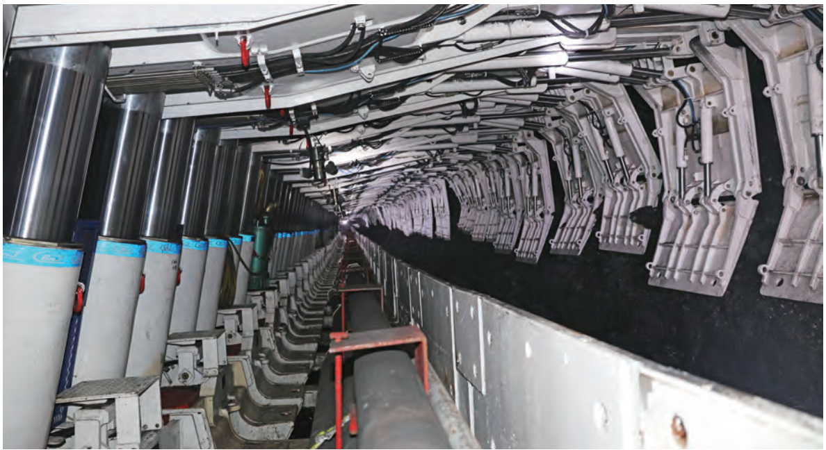
智能化开采工作面

打造智能化品牌。装备公司在国内最早实施了薄煤层采煤机、刨煤机智能化开采研发项目，主导和参与了黄陵、张集等十余个智能化工作面的三机配套，培育了国内实力最强的智能化开采成套技术研发及产业化力量。装备公司正在集中尖端技术力量，全力推进实施“中天合创智能化开采工作面项目”“华晋焦煤智能化放顶煤项目”，力争通过自动化、信息化、网络化等前沿智能技术的集成创新与产业应用，进一步创新完善综采综放工作面智能化系统解决方案，打响“中煤智能化”品牌，更好地为用户创造价值，引领行业创新发展。