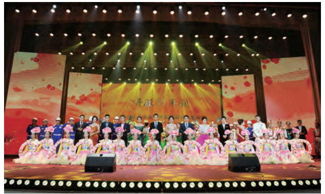
平朔矿区庆祝改革开放40周年文艺晚会