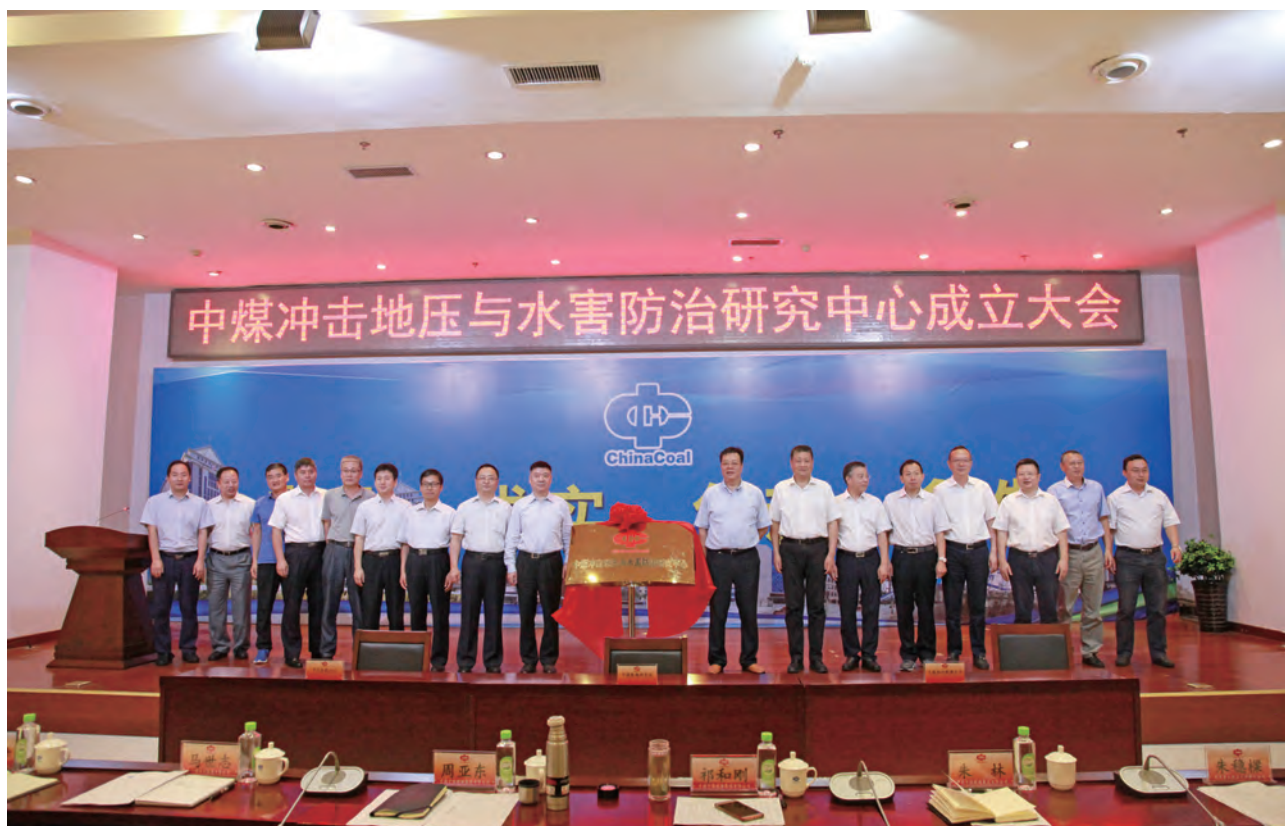
中煤冲击地压和水害防治研究中心

2018年，公司取得一批高水平重要科技成果，核心技术竞争力进一步增强。本年度获得行业科技进步奖21项，授权专利155项，核心技术支撑产业发展的能力不断提升。