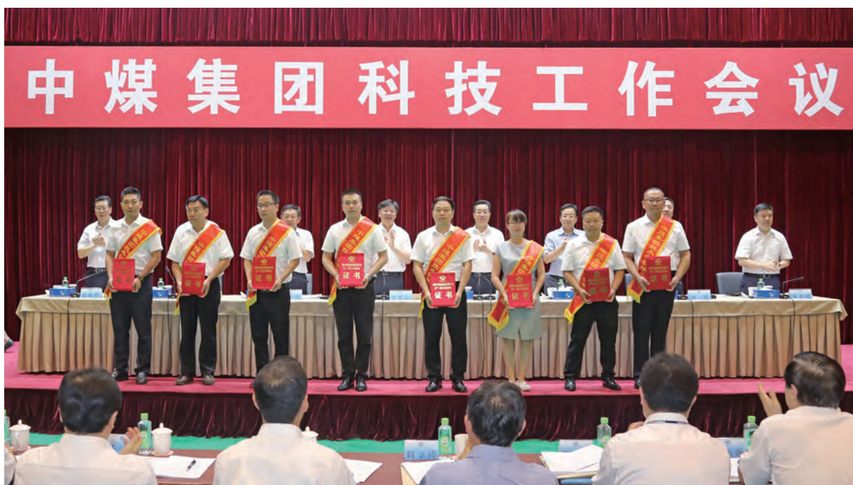
中煤能源科技工作会议