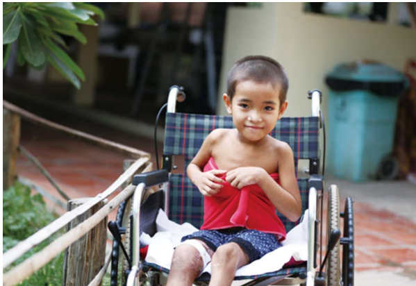
柬埔寨吳哥兒童醫院受益兒童