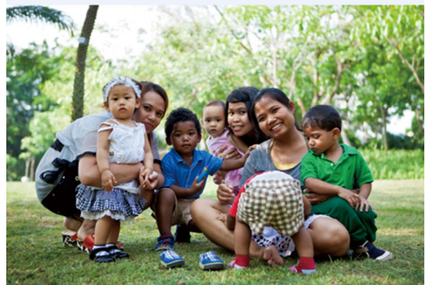
香港NGO活動受益兒童