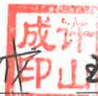
许山成 主管会计工作的 公司负责人