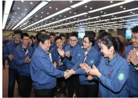
“激情成就梦想”青年员工交流会