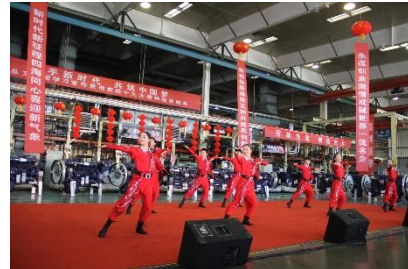
“携手新时代 共筑中国梦”慰问演出