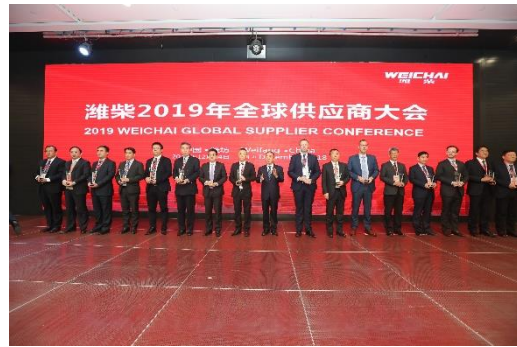
潍柴 2019 年度商务大会现场