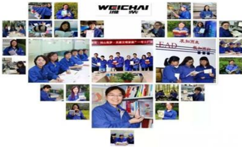
“引领女性阅读·建设文明家庭”读书活动