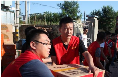
“情系灾区，奉献爱心”捐款活动

2018年8月，潍坊11个县市区遭受严重洪灾，公司组织“情系灾区，奉献爱心”捐款活动，得到广大员工的积极响应，不到一天时间筹集救灾款100多万元，公司第一时间将100多万元救灾款送到受灾群众手中，帮助受灾群众一起进行灾后重建工作。