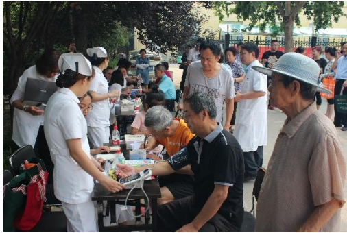
尊老爱老，服务老职工

全年走访慰问老职工356人次；为79名离休干部和老工人，办理就医医院签约、医疗证年审、药费凭证收取、审核报销；为117名遗属发放生活困难补助金；为退休职工办理慢性病证、医疗报销。组织球类、瑜伽、诵读、书画展、摄影展、文艺演出等文化体育活动38场。让广大退休职工充分感受到了企业的关怀和幸福感、参与感和获得感。