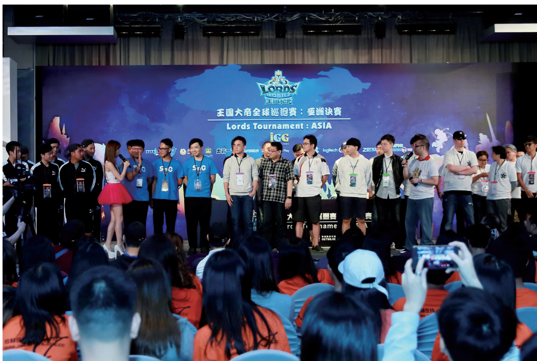
《王國紀元》王國大帝全球巡迴賽：亞洲決賽