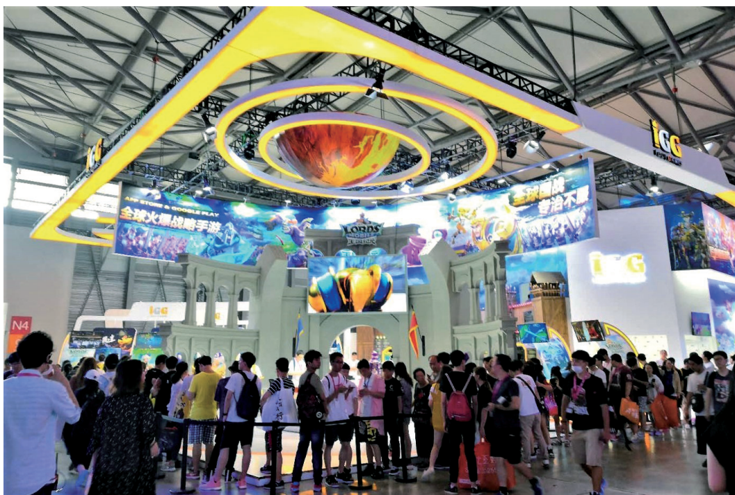
中國國際數碼互動娛樂展覽會 (ChinaJoy)