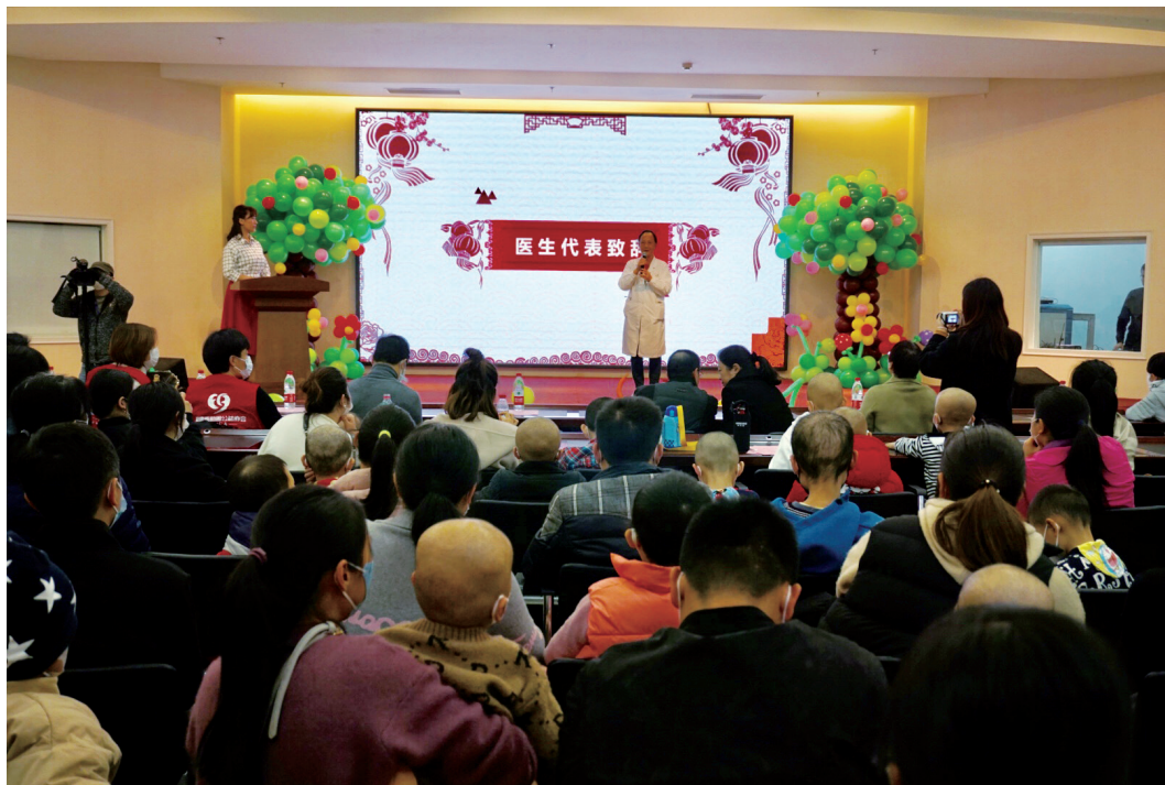
「病房教室」新年活動

二零一八年，IGG 菲律賓公司向公益組織 Gawad Kalinga 捐款，為有需要的孩子提供營養餐食。