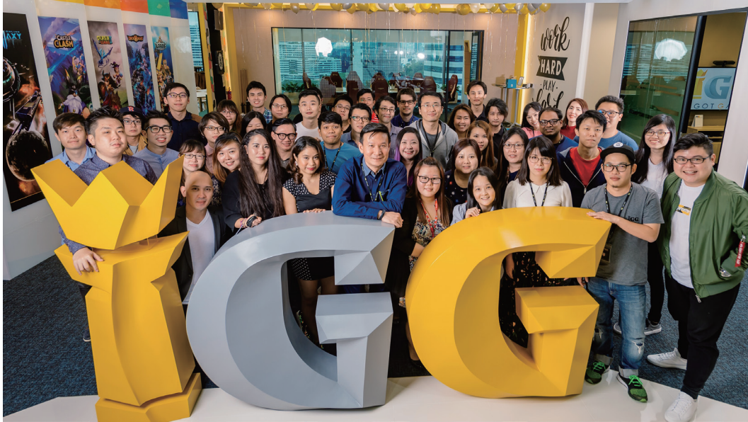
新加坡公司員工合影