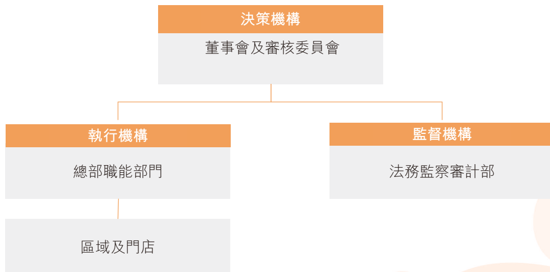
（圖一：風險管理組織架構）