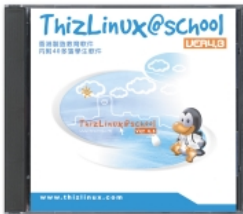
ThizLinux@School (僅已推出試驗版本)

為推廣Linux應用，本集團運作 thizlinux.com 網站，登載有關Linux之最新實用資料，包括(i) Linux社群消息；(ii)安裝指南；(iii)解答有關Linux之常見提問；(iv)技術支援；及(v)購置ThizLinux。