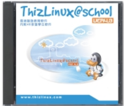
ThizLinux@School (僅已推出試驗版本)

為推廣Linux應用，本集團運作 thizlinux.com 網站，登載有關Linux之最新實用資料，包括(i) Linux社群消息；(ii)安裝指南；(iii)解答有關Linux之常見提問；(iv)技術支援；及(v)購置ThizLinux。