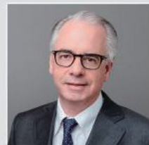
Ulrich Körner 資產管理行政總裁