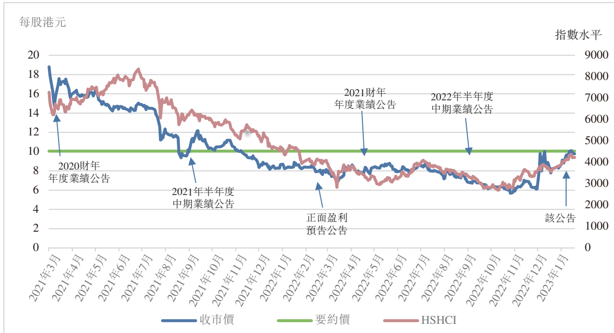
圖2：股份之相對過往價格表現及HSHCI指數變動